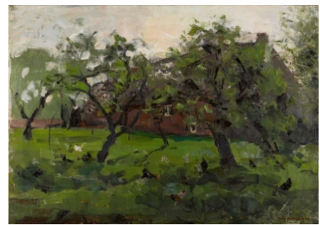
Piet Mondriaan, Boomgaard met kippen, 1901, olieverf op doek. Collectie Kunstmuseum Den Haag

Mondriaan senior erkent het tekentalent van zijn zoon op jonge leeftijd. De jonge Piet assisteert zijn vader bij het vervaardigen van zijn prenten. Op aandringen van zijn vader behaalt Piet zijn bevoegdheid om tekenleraar te worden. Tot ongenoegen van zijn vader, die het kunstenaarsleven onzeker acht, vertrekt Piet naar Amsterdam om te studeren aan de Rijksakademie voor Beeldende Kunsten. De relatie tussen vader en zoon was hecht en moeizaam tegelijkertijd. Verschillende archiefstukken, waaronder brieven, geven nieuw inzicht op de relatie tussen zoon en vader.