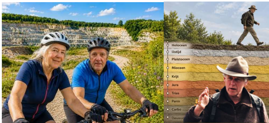
Lies & Bart & Stef & Medegidsen: veldexperts, waterkenners, rivierkenners, lokale deskundigen