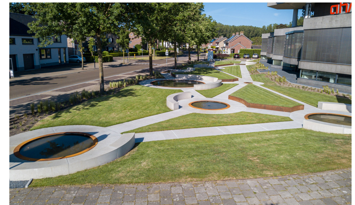
Gabriel Lester, Aqua Spectra , 2020

Op het voorterrein van Ahrend vertakt het Wandelpad in een stelsel van paden. De veelhoekige vormen doen denken aan de polygone vorm van het gebouw. Op de kruispunten van de paden zijn waterspiegels te zien. In het voorbijgaan vormt de reflectie in het water een plotseling venster. Het is alsof fragmenten uit de realiteit zijn geknipt en geplakt; een soort hedendaagse vorm van beeldbewerking. Het spiegelwater is – in principe – regenwater dat via de daken van Ahrend wordt opgevangen; een verwijzing naar de watermachines die de regionale waterhuishouding typeren. 's Avonds lichten de waterspiegels op en wordt de sfeer magisch. (41)