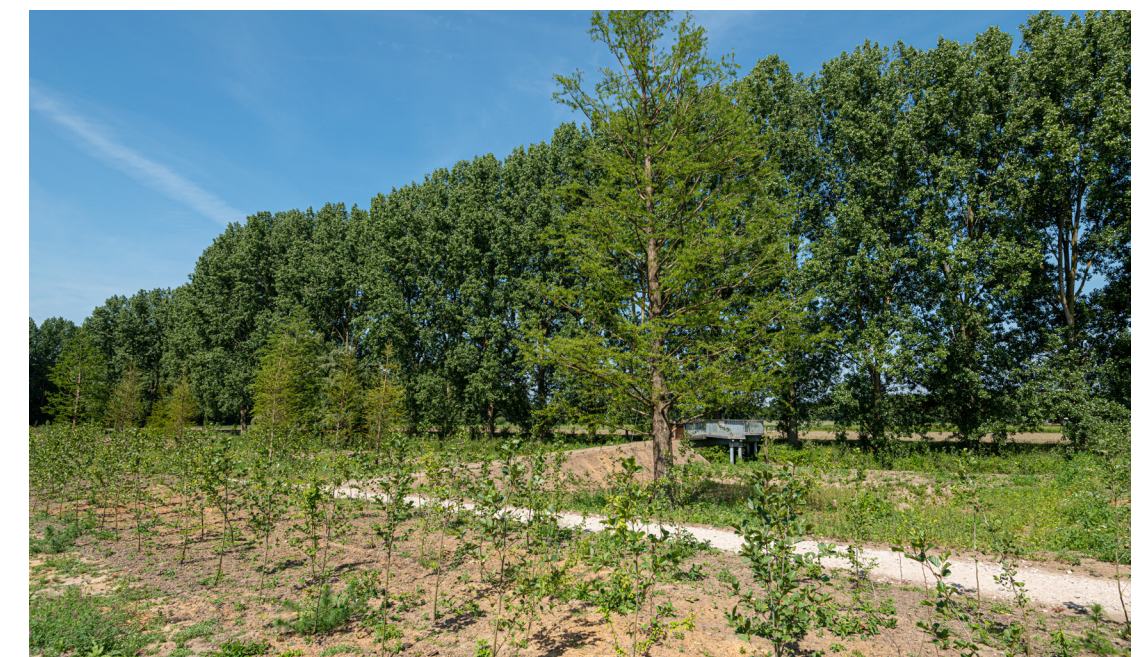
Paul Roncken, Duizendjarig Woud , 2020

Het Duizendjarig Woud is een betoverend moerasbos. Je waant je in een exotisch woud waar je de eindeloze tijd kunt ervaren. Er staan bomen die minstens duizend jaar oud kunnen worden. Ze zijn in verschillende leeftijdsklassen en variaties aangepant en bestand tegen klimaatverandering. Ze kunnen optimaal gedijen in het dynamische milieu van de Dommel. De groene ondergroei verandert door het jaar heen voortdurend. Deze nieuwe biotoop zal de flora en fauna langs de Dommel versterken. (44)