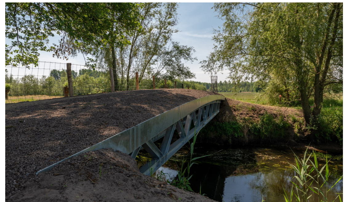
Birthe Leemeijer, Leestekens in het landschap , 2020

Zonder onderbreking kan de wandelaar via de Hooibrug zijn weg over de Dommel vervolgen. Het landschap is hier doorgezet boven het water en biedt plaats aan planten, dieren en mensen. Ook met hulp van andere 'leestekens' maakt Birthe Leemeijer het landschap leesbaar. Met oude en nieuwe bouwstenen borduurt zij met het Uitkijkpunt, de Hooibrug en een aantal tourniquets voort op kenmerken uit de omgeving, zoals het bloemrijk hooilandschap, de populieren, de schuren met verzamelingen van oude voorwerpen en materialen, en het ambachtelijk klompen maken. Een belangrijk uitgangspunt is dat bestaande landschappelijke elementen het beeld bepalen en dat het wandelpad wordt opgenomen in de omgeving. (43)