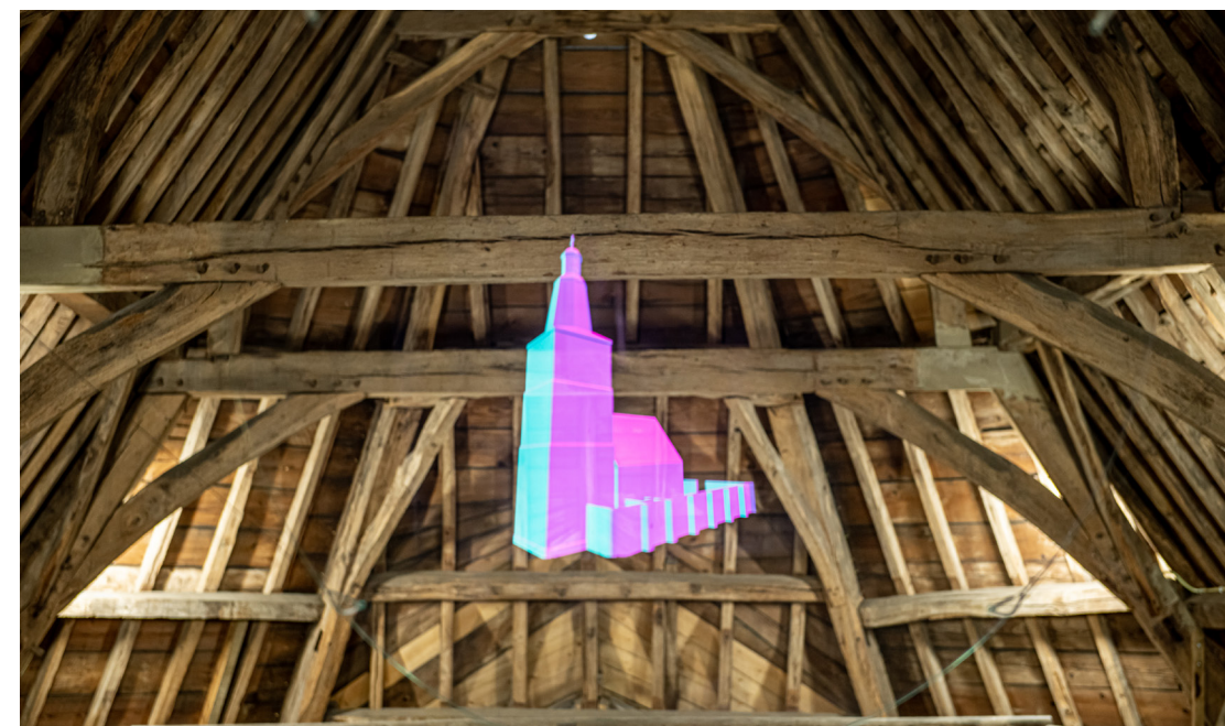
Geert Mul, Morphologie, Geschiedenisjes, Panorama en Kosmologie , 2020

Het beklimmen van de Knoptoren is een belevenis. De wenteltrap voert langs 15 Geschiedenisjes; kleurrijke raampjes die de vensters vormen op de rijke geschiedenis van de kerk. Halverwege de klim is op de zolderkamer een animatie van het kerkgebouw te zien, als een soort fata morgana. Eindpunt van de beklimming is de torenkamer. Op vier beeldschermen is het uitzicht te zien door de 4 seizoenen heen. Deze 'Kosmologie' vormt een tweelুক met een videowerk in de benedenzaal. Met deze kunstwerken wil Geert Mul het gebouw vormgeven als cultureel medium dat getuigt van zijn eigen religieuze en immateriële geschiedenis. (42)