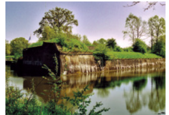
Fort Lunet I

Het Kromme Rijnpad komt langs Fort Lunet I, dat samen met de drie andere Lunetten en het inundatiekanaal onderdeel is van de Nieuwe Hollandse Waterlinie. Het kanaaltje moest water uit de Lek naar lager gelegen land transporteren. Door een gebied onder water te zetten, bleef de vijand op veilige afstand. Nu doet Lunet I dienst als buitenschoolse opvang. Ook Stichting Vredeseducatie is er gehuisvest met 'Fort voor de Democratie'.