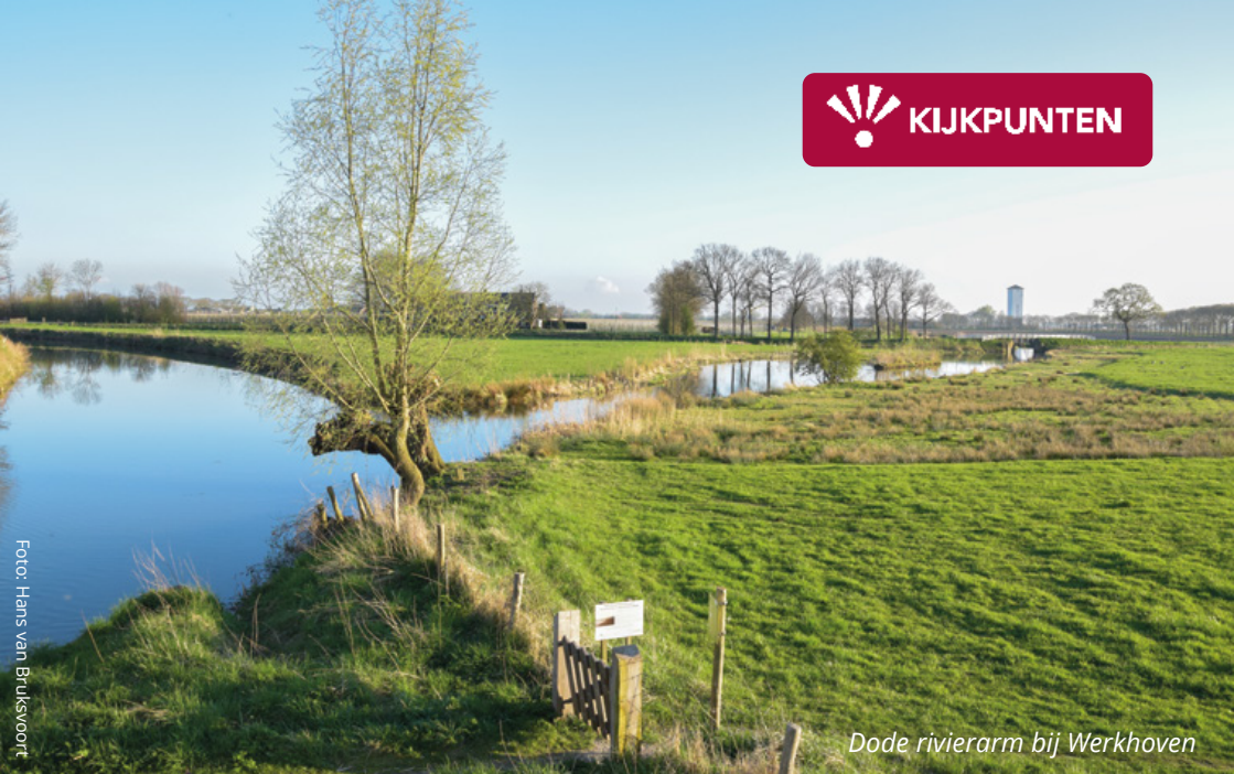
Dode rivierarm bij Werkhoven