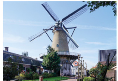
Molen Oog in 't Zeil