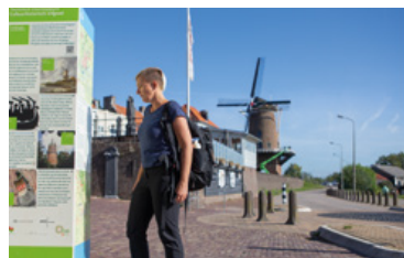
Walmuur Wijk bij Duurstede

Vanaf de Stadshaven kun je lekker uitwaaien langs de Lek en het Amsterdam-Rijnkanaal. Via groenstroken bereik je Kasteel Duurstede. Slenter door de oude binnenstad met Markt, Grote Kerk en Peperstraat met winkels en galeries. Daarna volgt de molen, walmuur en Waterpoort. Een aaneenschakeling van highlights!