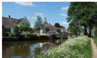
Bunnik met de Oude Dorpskerk

De sierlijke brug, vroeger fungerend als tolbrug, nodigt uit om Bunnik te verkennen. Het brinkdorp ontstond rond de 8e eeuw op een oeverwal van de Kromme Rijn. Vanaf de brug leidt de Dorpsstraat naar het voormalige raadhuis in neorenaissancestijl (1897). Erachter staat de 12e-eeuwse Romaanse toren van de Oude Dorpskerk. Ertegenover ligt de voormalige smederij, tegenwoordig in gebruik als Café-Restaurant 't Wapen van Bunnik.