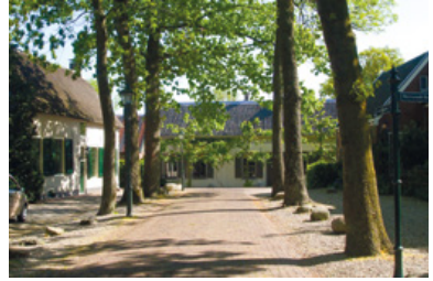
De Brink in Cothen

Op de Brink in Cothen, aangewezen als beschermd dorpsgezicht, waan je je in vroeger tijden. Oorspronkelijk fungeerde de Brink als verzamelplaats voor vee; later kreeg het de functie van centraal dorpsplein. Cothen is een typisch Kromme Rijndorp. Net als Werkhoven, Odijk en Bunnik ligt het op een stroomrug van de Kromme Rijn. De landbouwgronden lagen naast het dorp.