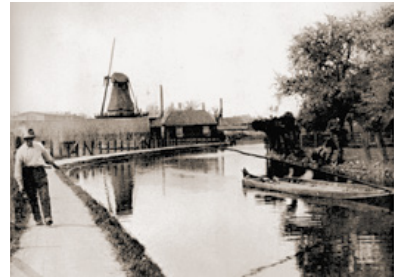
Trekschuit op de Kromme Rijn

De kentering vond plaats in 1122. Het rijke en machtige Utrecht wilde uitbreiden door het lager gelegen zompige Langbroek te ontginnen. Maar het water, afkomstig van de telkens overstromende Kromme Rijn, vormde een probleem. Daarom besloot bisschop Godebald in 1122 de Kromme Rijn af te dammen bij Wijk bij Duurstede. Sindsdien stroomt het Rijnwater via de Lek naar zee. De woeste Kromme Rijn was voorgoed veranderd in een rustige stroom. Scheepvaart was niet langer mogelijk. De rivier was alleen bevaarbaar voor ondiepe trekschuiten, vanaf de kant getrokken door de mens. Er werd een speciaal pad aangelegd voor de trekker: het jaagpad, waar het Kromme Rijnpad nu overheen loopt.