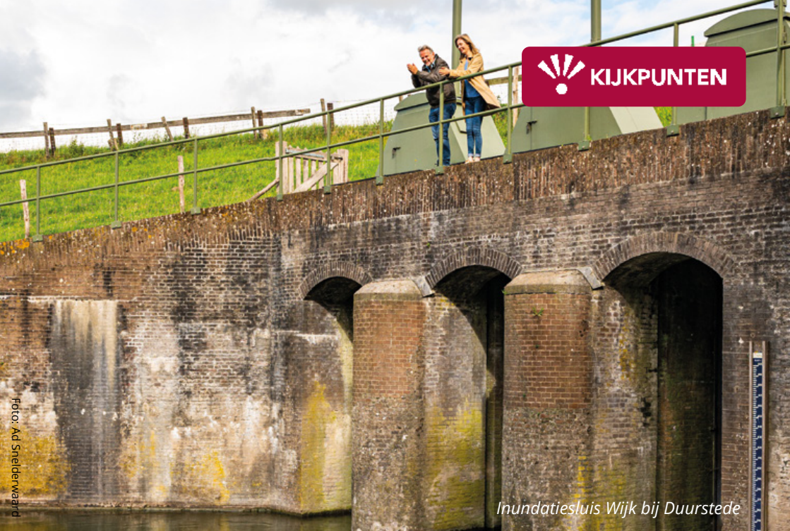
Inundatiesluis Wijk bij Duurstede