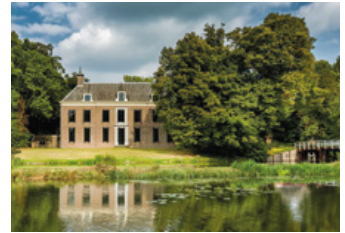
Museum Oud Amelisweerd

De kamers van het oude landhuis herbergen iets bijzonders: ze zijn voorzien van 18e-eeuwse Chinese behangsels met afbeeldingen van de natuur. Het behang, hiernaartoe gebracht in de VOC-tijd, is zeer zeldzaam. Het Pop-up museum exposeert oude voorwerpen uit het interieur van Utrechtse kastelen, samen met moderne kunst in wisselende tentoonstellingen. www.landhuisoudamelisweerd.nl