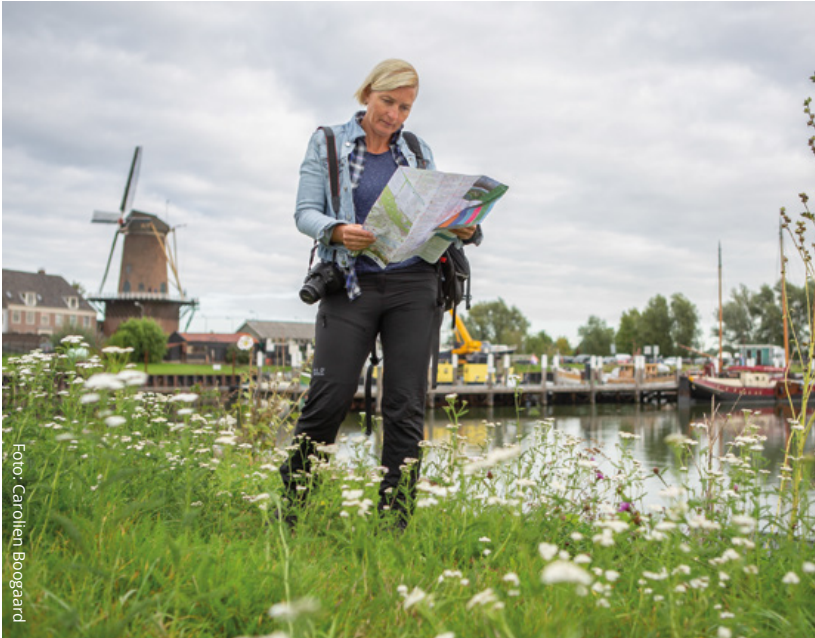
De Wijkse haven