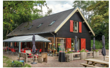
Smaak van Fort Lunet IV

Vier forten op rij, dat zie je zelden. Ze zijn onderdeel van de Nieuwe Hollandse Waterlinie. Je bereikt ze via een inundatiekanaaltje dat dwars door de Utrechtse wijk Lunetten loopt. Lunet IV is – met lunchroom, vergader- en feestruimtes – het meest toegankelijk voor publiek. Laat je verrassen, kom langs.