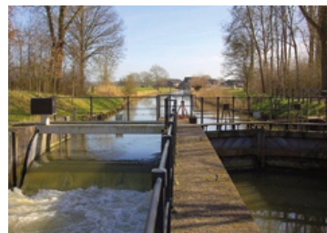
Sluisje bij Werkhoven

Vlak voor de brug over de rivier ligt een schutsluisje met stuw. De sluis is aangelegd rond 1870, toen de Kromme Rijn onderdeel werd van de Nieuwe Hollandse Waterlinie. Met behulp van sluisen kon het land tijdens oorlogsdreiging extra snel onder water worden gezet. De stuw naast de sluis houdt het waterpeil tussen Cothen en Werkhoven op orde. Het peilverschil bedraagt 1,10 meter.