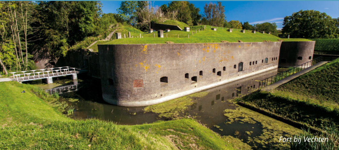
Fort bij Vechten

De Nieuwe Hollandse Waterlinie is sinds juli 2021 onderdeel van UNESCO Werelderfgoed de Hollandse Waterlinies. Dit erfgoed staat volop in de belangstelling. De forten, waar vroeger soldaten de wacht hielden in kille en donkere gangen, zijn gerestaureerd. Nu kun je er wandelen, een museum bezoeken, lekker eten en drinken.