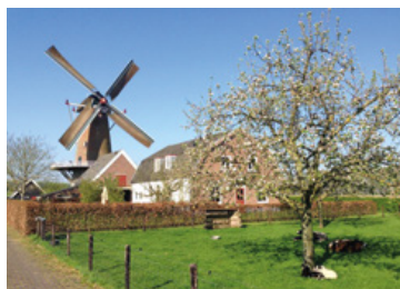
Molen Rijn en Weert