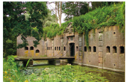
Fort bij Rijnauwen

Meer informatie vind je op: www.nieuwehollandsewaterlinie.nl