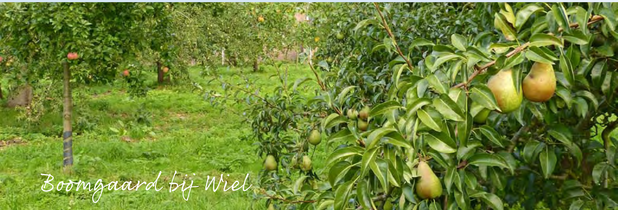
Boomgaard bij Wiel

De Hollandse polders liggen lager dan de Gelderse. Daardoor kon in de middeleeuwen overtollig water zo Holland binnenstromen. De aanleg van de Diefdijk rond 1284 moest een einde maken aan deze wateroverlast. Dat de dijk niet altijd standhield, bewijzen verschillende wielen (kolksgaten). Dramatisch was de doorbraak van 1573, toen de dijk instortte op een zwakke plek met veel zand in de ondergrond. Het 12 meter diepe Schoonrewoerdse Wiel – ook wel Wiel van Bassa genoemd – bleef als een litteken achter in het landschap. De nieuwe dijk werd vervolgens om het gat gelegd. De zandige ondergrond heeft er trouwens wel voor gezorgd dat fruitbomen het hier goed doen. Het Zuid-Hollands landschap koestert de traditionele hoogstambomen, die elders helaas veelal uit het landschap zijn verdwenen.