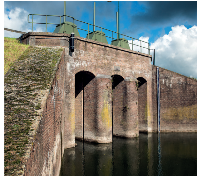
Inundatiesluis in Wijk bij Duurstede

In de Kromme Rijnstreek is het historische landschap van de Nieuwe Hollandse Waterlinie bijzonder goed bewaard gebleven en nog volop beleefbaar. Deze drie fietsroutes geven je een mooi beeld van het militair erfgoed in de achtertuin van Wijk bij Duurstede. Laat je verrassen door forten, loopgraven, dijken, sluisen, kanalen, kazematten en groepsschuilplaatsen. Samen vormden deze elementen een ingenieus systeem dat Nederland vroeger beschermde tegen vijandelijke troepen. Door het land zo'n vijftig centimeter onder water te zetten werd het onbegaanbaar voor soldaten en te ondiep voor boten. Fiets je mee om dit oer-Hollandse verdedigingssysteem uit de 19e en 20e eeuw te ontdekken? De fietsroutes starten vanaf de TOP bij de stadshaven van Wijk bij Duurstede.