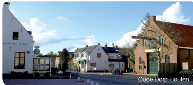
Oude Dorp Houten

Bos Nieuw Wulven is een jong bosgebied van Staatsbosbeheer waar kan worden gewandeld en gefietst. In het gebied komen wel 50 verschillende vogels voor, waaronder de blauwborst en de ijsvogel. Ook worden er reeën en vossen gespot. In het bos bevindt zich één van de grootste speelbossen van Nederland. Kinderen kunnen er klimmen en klauteren, met water spetteren, hutten bouwen, dwalen in het dwaalbos en nog veel meer!