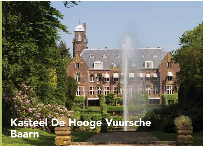
Kasteel De Hooge Vuursche Baarn

Bijgaand enkele suggesties voor de invulling van uw bijeenkomst. Om een goede indruk van onze locatie te krijgen nodigen wij u graag uit voor een rondleiding. Bel voor een afspraak 035-54 12 541. Voor een eerste indruk verwijzen wij u graag naar: www.hoogevuursche.nl