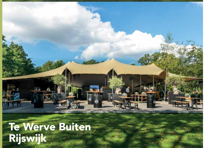
Te Werve Buiten Rijswijk