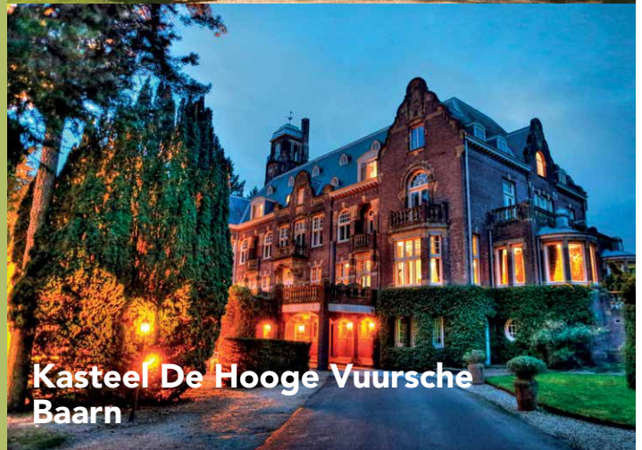
Kasteel De Hooge Vuursche Baarn