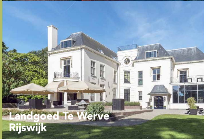
Landgoed Te Werve Rijswijk