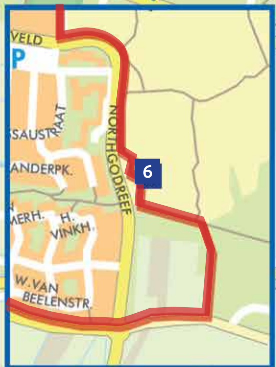
Wandeling door dungebied Walk through the dunes Spaziergang durch die Dünen