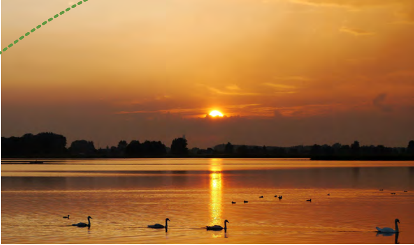
Stootersplas - Annelies Schreuder