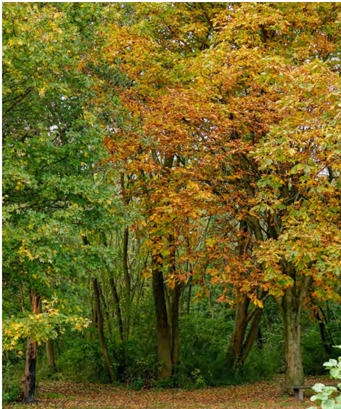
Het Smaal - Pauli van Oort

spelen een belangrijke rol in het beheer van dit deelgebied. Ze voorkomen dat struikgewas en bomen de kans krijgen om te groeien.