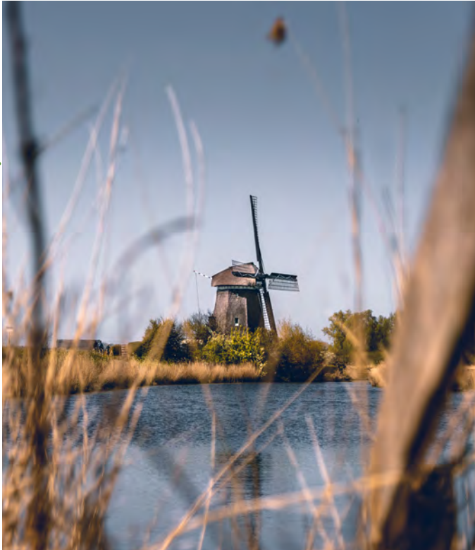
De Twiskemolen

je meer over de Twiskemolen kunt lezen. Of bekijk de website www.twiskemolen.nl