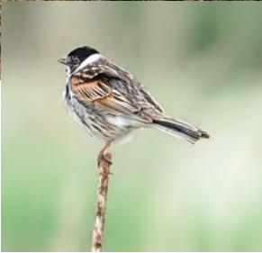
Rietzanger - Pauli van Oort