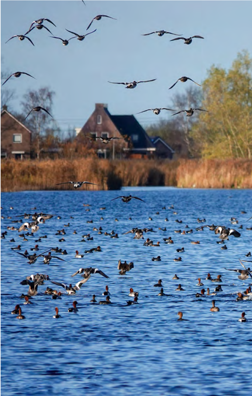
Smienten op het Stootersplas - Pauli van Oort