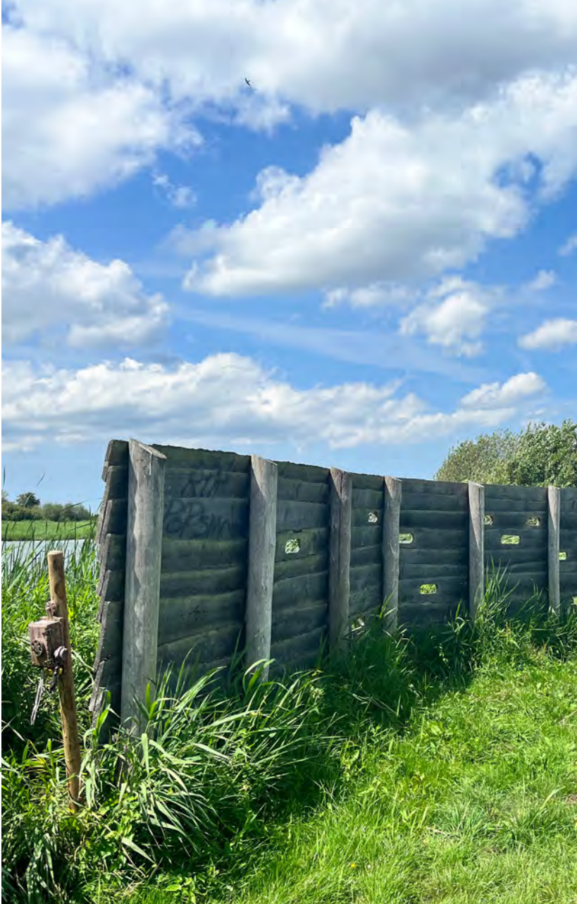
Vogelkijkwand Het Twiske