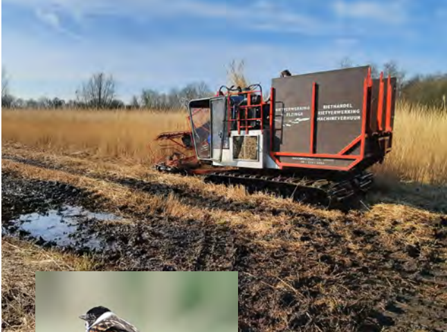
De Belt - Marco Woudstra