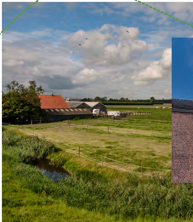
Uitzicht polder Beemster