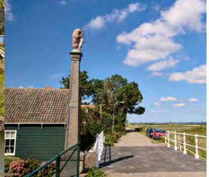
Banpaal in Scharmdam