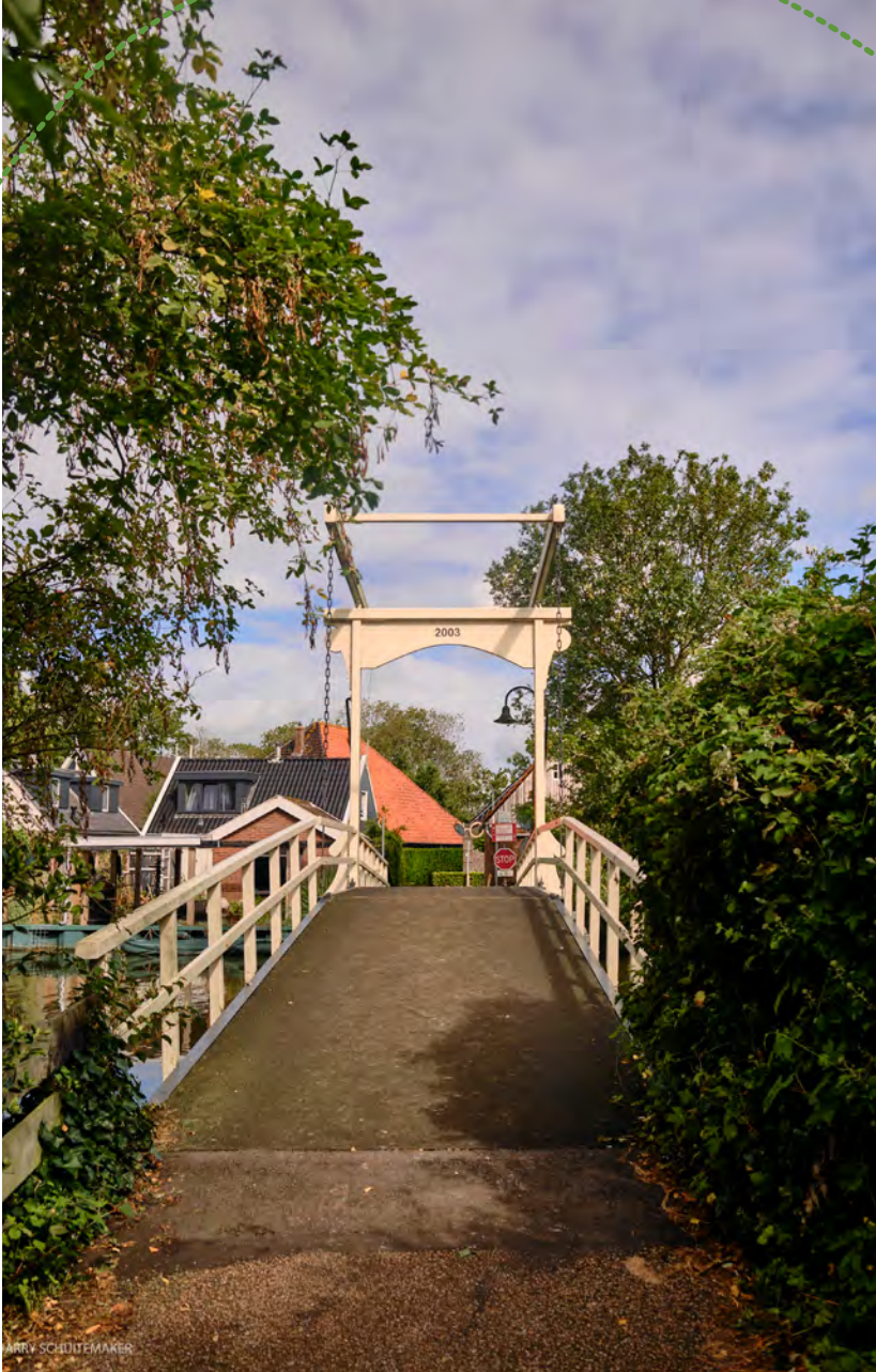
Brug over de Korsloot bij Beets