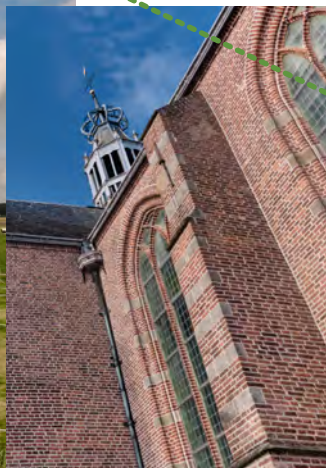
Grote Kerk Oosthuizen

tafel verdeeld in tientallen rechte, gelijkmatige stukken. Aan deze unieke inrichting heeft De Beemster sinds 1999 haar UNESCO-status te danken. Vanaf dit punt heb je een goed zicht op de bijzondere structuur van de polder én het grote verschil in waterniveau.