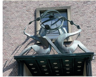
kunstenaar: Charles Hammes titel: Het Geldverkeer jaartal: 1954 plaats: Klein Mariënburg (10)

Voorbij de varkentjes loopt u langs een statig oud gebouw, dit was vroeger dus een bank. Het gebouw heeft een gasdichte atoomschuilkelder. Deze werd gebouwd tijdens de Koude Oorlog, uit angst voor de Russen. De architect H.T. Zwiers, heeft de kunstenaar Charles Hammes betrokken bij de bouw. Boven de hoofdingang ziet u een koperen kunstwerk met de titel 'Het Geldverkeer'.