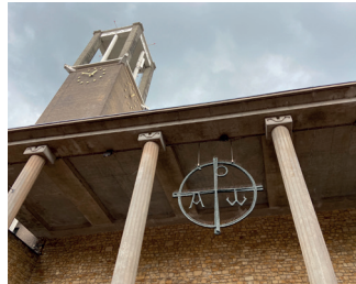
Kunstenaar: Jan Vaes titel: Gevel Mariakapel met het Christus Monogram jaartal: 1959 plaats: Molenstraat 37, Petrus Canisiuskerk (5)

Loop een stukje terug naar de hoek waar u vandaan kwam, en steek Plein 1944 over aan de rechterkant. Een stukje verder ziet u rechts voor u, de hoge klokkentoren van de Petrus Canisiuskerk. Volg de winkelstraat, u bereikt deze kerk als u bij de kruising met de Molenstraat rechtsaf gaat. De voorgevel met kunstwerken is een zeer bijzonder voorbeeld van wederopbouwkunst. De gevel van de Mariakapel en het Christusmonogram met de Griekse letters XP (Ch R), zijn door de kunstenaar Jan Vaes ontworpen.