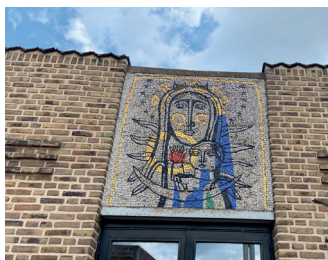
kunstenaar: Jan van Eijk titel: Moeder Gods jaartal: 1960 locatie: Kroonstraat 148 (4)

Boven de ingang van de kapel ziet u het kleurige mozaïek van Jan van Eijk.