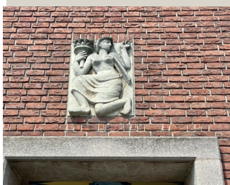
kunstenaar: Jo Uiterwaal titel: Twee reliëfs jaartal: 1953 plaats: Stationsplein (1)

In het portaal, afgesloten door een glaswand, zijn met geglazuurde bakstenen, sierlijke elementen aangebracht. Op het plafond ziet u een gietijzeren versiering in de vorm van een ster en tegen de achterwand een kunstwerk van Charles Hammes. De treinen en huizen wervelen op een speelse manier rondom de mannenfiguur.