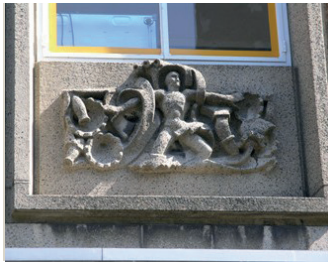
kunstenaar: Jac Maris titel: Zes reliëfs jaartal: 1953 plaats: Burchtstraat 3 (8)

Als u zich omdraait ziet u op Burchtstraat nummer 3 een monumentaal winkelpand met onder de ramen zes gestileerde reliëfs van Jac Maris.