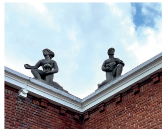
kunstenaar: Jo Uiterwaal titel: Twee knielende figuren jaartal: 1953 plaats: Stationsplein (2)

Wanneer u naar links kijkt, ziet u helemaal achteraan het plein, boven op de gevel 'Twee knielende figuren' van Jo Uiterwaal.