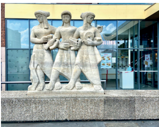
kunstenaar: Jo Uiterwaal titel: Drie staande figuren jaartal: 1953 plaats: Stationsplein (1)

Als u recht voor het station staat, ziet u links naast de hoofdingang het beeld 'Drie staande figuren' van Jo Uiterwaal. Achter het beeld is een portaal, daarboven ziet u Twee reliëfs van dezelfde kunstenaar.