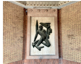
kunstenaar: Charles Hammes titel: Reliëf jaartal: 1955 plaats: Stationsplein (1)

In het portaal, afgesloten door een glaswand, zijn met geglazuurde bakstenen, sierlijke elementen aangebracht. Op het plafond ziet u een gietijzeren versiering in de vorm van een ster en tegen de achterwand een kunstwerk van Charles Hammes. De treinen en huizen wervelen op een speelse manier rondom de mannenfiguur.