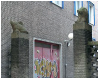
kunstenaar: Charles Hammes titel: Twee spaarvarkens jaartal: 1954 plaats: Mariënburgsestraat (9)

U loopt de Burchtstraat verder uit tot bijna aan het einde van de winkelstraat, ga rechtsaf de Mariënburgsestraat in. U passeert een steegje met de naam 'De Spaarpot'. Bij de ingang van het steegje zitten twee spaarvarkentjes op pilaren, vlak voor het vroegere bankgebouw ernaast. De varkentjes vormen een knipoog waarmee Charles Hammes de waarde van geld heeft willen relativeren.