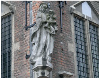
kunstenaar: Albert Termote titel: Mariabeeld jaartal: 1950 en 1953 plaats: Burchtstraat, gevel stadhuis (7)

Op de linkerhoek sluit een Mariabeeld de rij.