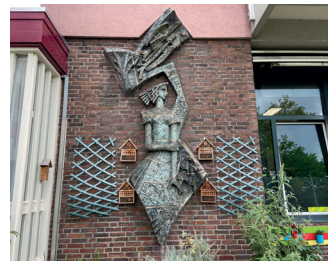
kunstenaar: Jac Maris titel: Reliëf jaartal: 1958 plaats: Sint Jorisstraat 72 (11)

Loop door in deze straat, Klein Mariënburg, steek het Hertogplein over en ga de Gerard Noodtstraat in, tot u aan het einde op de T-splitsing komt. Ga rechtsaf de Sint Jorisstraat in. Loop naar het laatste pand op de hoek met de Sint Canisius-singel. Om de hoek, op nummer 72, ziet u op de gevel een kunstwerk van Jac Maris.