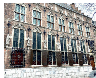
kunstenaar: Albert Termote titel: Acht keizerbeelden jaartal: 1950 en 1953 plaats: Burchtstraat, gevel stadhuis (7)