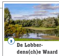
3 De Lobberdens(ch)e Waard

Na een bouwtijd van drie jaar werd Fort Pannerden in 1872 in gebruik genomen. Het fort ligt op een strategisch punt: waar Waal en Rijn zich splitsen. Het fort diende als vooruitgeschoven post van de Hollandse Waterlinie. Het fort is al snel na de ingebruikneming gemoderniseerd en uitgebreid. Na 1920 is het niet meer gebruikt. In 1988 werd Staatsbosbeheer eigenaresse van het fort. Sinds 2007 heeft Fort Pannerden, na een grootscheepse restauratie, een cultuurhistorische bestemming.