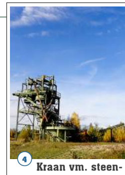
4 Kraan vm. steenfabriek

De Lobberdens(ch)e Waard – al dan niet met tussen ch geschreven – maakt deel uit van het omvangrijke uiterwaardengebied van het Pannerdensch Kanaal. Het gebied is sinds een aantal jaren in ontwikkeling als natuurgebied. De Lobberdense Waard is ruim 200 hectare groot.