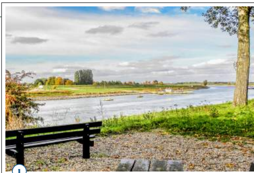
1 Pannerdensch Kanaal

De wandelroute begint bij de rooms-katholieke Martinuskerk aan het Dorpsplein, in het centrum van Pannerden. Met de rug naar de kerk lopen we naar links, voor het schutterij-gebouw Claudius Civilis langs (rechts), langs de Warme Bakker en de Drogisterij (links) naar