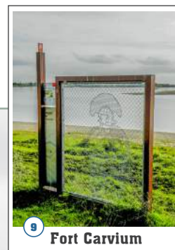
9 Fort Carvium

De Bijland is met een oppervlakte van ruim 300 hectare één van de grootste waterrecreatiegebieden van de provincie Gelderland. De waterplas staat in open verbinding met het Bijlandsch Kanaal (Rijn). De Bijland is niet alleen van betekenis voor de recreatie, de waterplas is eveneens belangrijk voor de overwintering van watervogels.