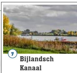
7 Bijlandsch Kanaal

Uit oude rivier- en topografische kaarten blijkt dat de sluis (in de Oude Waal) uit de 19de eeuw dateert. Het waren de eigenaren van de destijds aangrenzende steenfabrieken die veelal uit eigen belang voor het onderhoud van het sluisje zorgden. Het sluisje voorkwam dat de gronden waarop de stenen lagen te drogen, onder water kwamen te staan. Met de bouw van de sluis werd, in combinatie met het graafwerk voor het Bijlandsch Kanaal, een meander van de Oude Waal afgesneden.