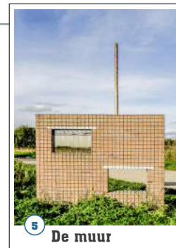
5 De muur

De 'dode' kraan langs de Lobberdenseweg in het Kijfwaardgebied van Pannerden symboliseert de neergang van de baksteenindustrie op het Gelders Eiland. Ooit werd het landschappelijk silhouet in dit gebied bepaald door meer dan tien steenfabrieken. Daarvan zijn er nog maar enkele over.