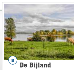
8 De Bijland

Waar de Oude Waal zich even vóór Tolkamer van de hoofdstroom afsplitst, begint het tussen 1773 en 1776 gegraven Bijlandsch Kanaal. Met het kanaal werd een scherpe meander in de Boven-Waal afgesneden. Bijkomend voordeel van een betere regulering van de stroom van het rivierwater was de verbetering van de vaarweg voor de scheepvaart.