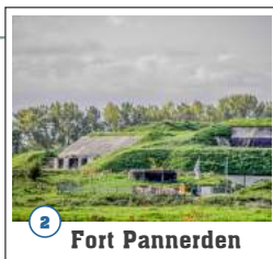
2 Fort Pannerden

belang van een goede wassertoevoer naar Neder-Rijn en IJssel werd al in dezelfde periode als waarin het kanaal tot stand kwam, tot een verbinding tussen beide waterwegen besloten.