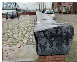
kunstenaar: Oscar Goedhart titel: Twee muursculpturen jaartal: 1982 plaats: vooraan Veemarkt (14)

Wandel met de bocht mee en volg aan het einde van de Waalkade, de bocht naar links, deze gaat over in de Veemarkt. In deze bocht, bovenaan de trap naar de brug, ligt het pas volledig opgeknapte zuidelijk landhoofd. Dit Torenmonument is in 1878 gebouwd om de spoorbrug te beschermen en verdedigen. Het bijzondere gebouw heeft zijn derde verdieping en de torenspitsen nu weer terug. Deze waren tijdens de Tweede Wereldoorlog door de Duitsers gedeeltelijk afgebroken om plaats te maken voor afweergeschut. Loop over de Veemarkt en zie in de keermuur twee muursculpturen van Oscar Goedhart.