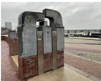
kunstenaar: Gerard Bruning titel: Muursculpturen jaartal: 1982 Plaats: ter hoogte van de Korte Brouwerstraat (9)

In de doorgang bovenaan het trapje bevinden zich de muursculpturen van Gerard Bruning.