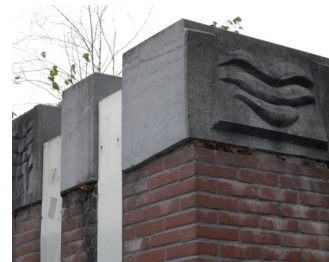
kunstenaar: Ed van Teeseling titel: Twee reliëfs jaartal: 1982 plaats: onderaan de Grotestraat (4)

Vanaf hier ziet u langs de gehele Waalkade de Walk of Waste. Alle afvalbakken langs de kade zijn door kunstenaars omgevormd tot unieke kunstobjecten. Loop terug en zie onderaan de brede trappen het baken aan de rivier, de sculptuur van Ari Berkulin.