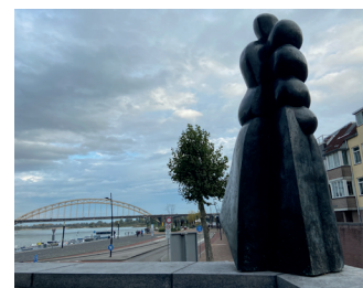
kunstenaar: Ed van Teeseling titel: Vrouw uitkijkend over water jaartal: 1982 plaats: bij de Lage Markt (5)

Loop de Waalkade verder af. Deze helft van de kade is de afgelopen jaren vernieuwd. Als bekroning van de nieuwe Waalkade is het beeld 'De Waterwolf' geplaatst op het grasveld dat u passeert.