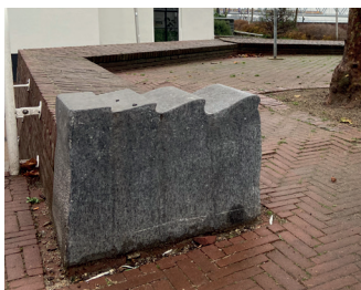
kunstenaar: Ben van Pinxteren titel: Twee muursculpturen jaartal: 1982 plaats: Achter de Vismarkt (7)

Passeer de doorgang en ga meteen rechts het hoekje om de trap op, u ziet op de uiteinden van de lage muurtjes een set van twee sculpturen van deze zelfde kunstenaar.