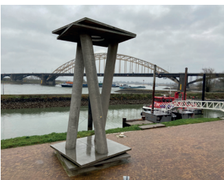
kunstenaar: Ari Berkulin titel: Sculptuur jaartal: 1995 plaats: ter hoogte van het Holland Casino (2)

De volgende doorgang in de muur, die bij de rotonde, loopt naar de Lage Markt. De muur wordt gemarkeerd door een beeld van Ed van Teeseling: Vrouw uitkijkend over water.