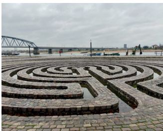
kunstenaar: Jaap van Hunen, Klaus van de Locht titel: Labyrinth jaartal: 1982 plaats: Waalkade (10)

Ter hoogte van de volgende doorgang ligt, u kunt het niet missen, het 'Labyrinth' van Klaus van de Locht en Jaap van Hunen. Vanaf de keringmuur heeft u een mooi uitzicht over dit werk dat ligt verzonken in de kinderkoppen van de Waalkade.