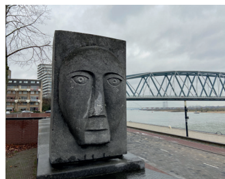
kunstenaar: Ben van Pinxteren titel: Januskop jaartal: 1982 plaats: ter hoogte van Kromme Elleboog (12)

Na het Labyrinth maakt de kademuur opnieuw een bocht; hier wordt de kade weer smaller. Bovenop de muur ziet u de Januskop van Ben van Pinxteren.