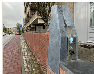
kunstenaar: Oscar Goedhart titel: Twee muursculpturen jaartal: 1982 plaats: vooraan de Veemarkt (13)

Vlakbij de Januskop bevindt zich een zwarte marmeren plaat met tekst in de keermuur die verwijst naar de hulp door de Nijmeegse bevolking aan tienduizenden Belgische krijgsgevangenen. Deze werden in de periode mei-juni 1940 in mudvolle rijnaken over de Waal vervoerd naar de nazikampen.