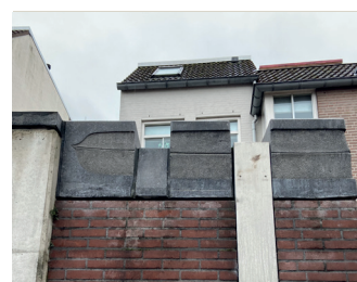
kunstenaar: Ben van Pinxteren titel: Drie muursculpturen jaartal: 1982 Plaats: doorgang Achter de Vismarkt (6)