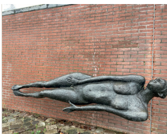
kunstenaar: Paul de Swaaf titel: Wachteres jaartal: 1983 plaats: ter hoogte van de Oude Haven (8)

Loop terug en vervolg de kade. De waterkeringmuur maakt al snel een scherpe bocht naar links. De kade wordt hier veel breder. Tegen de muur, voor de trap, ziet u een beeld van een liggende vrouw, het is de 'Wachteres' van Paul de Swaaf.