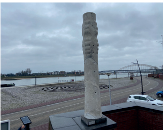
kunstenaar: Peter van de Locht titel: Architectuur der natuur jaartal: 1983 plaats: ter hoogte van de Oude Haven (11)

Tegenover het Labyrinth, op de keermuur, ziet u de marmeren sculptuur van Peter van de Locht, broer van Klaus van de Locht.