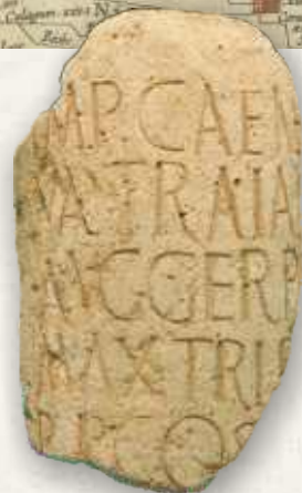
Fragment van een mijlpaal uit de tijd van Keizer Trajanus (98-117 na Chr.), opgericht langs een van de wegen bij Nijmegen.

De Romeinse grens was niet alleen een 'ijzeren gordijn', het was ook een lijn waarlangs personen en goederen werden vervoerd. Dat gebeurde over het water van de grote rivieren en over de weg. Slim aangelegde en zorgvuldig onderhouden wegen waren een Romeinse specialiteit. Ingenieurs van het leger zochten de kortste routes over de meest geschikte terreinen uit. Onder militair toezicht werden de wegen daarna aangelegd. Ze waren meters breed, hadden een bol oppervlak om het water af te laten lopen, greppels en bermen en een verharding van plaatselijk aanwezig materiaal. Zulke wegen, verhard met grind, zijn ook in Nijmegen gevonden. Het is ook bekend waar de wegen vanuit Nijmegen naartoe liepen. Eén voerde via Cuijk langs de Maas richting Maastricht en Tongeren, een ander verbond de stad met de kust in het westen en het Rijnland in het oosten.