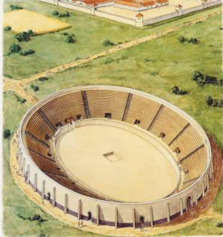
Het NEC stadion van de oudheid: het amfitheater van Nijmegen, goed voor 12.000 bezoekers.

het kampdorp. Maar zonder leger was er weinig handel meer en de markt heeft waarschijnlijk niet lang gefunctioneerd. Er is maar weinig afval gevonden bij opgravingen, een veeg teken. Misschien hadden de burgers meer plezier van het amfitheater van het legioen. Soldaten én stedelingen hielden van de ruwe 'sporten' waarbij gladiatoren elkaar op leven en dood bevochten, of op gevangen wilde dieren werd 'gejaagd'. Deze arena bleef in gebruik, lang nadat het leger was afgereisd. Hij was wel wat ruim bemeten voor de paar duizend omwonenden: er was plaats voor 12.000 toeschouwers!