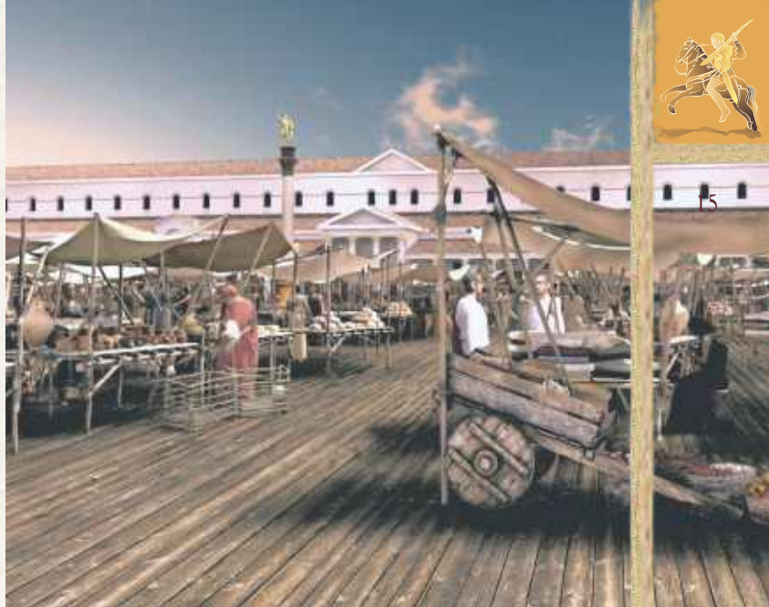
Op de binnenplaats van het grote marktgebouw staat een zuil. Een reconstructie van de zuil staat nu in de Eikstraat, maar zonder keizerbeeld.

Ga rechtsaf de Heydenrijkstraat in, loop door tot de Berg en Dalseweg, steek deze over en vervolg uw weg via de Museum Kamstraat.