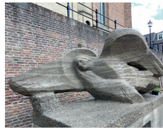
kunstenaar: Mari Andriessen titel: Monument voor de burgerslachtoffers van de Tweede Wereldoorlog jaartal: 1959 plaats: Sint Stevenskerkhof (3)

U loopt richting de Primark links het plein af. Ga meteen rechtsaf via de Augustijnenstraat naar de Grote Markt met het Waaggebouw. Midden op het plein staat het bekende Marikenbeeld. U zou het niet bedenken, maar er bestaat een relatie tussen dit beeld en de Nijmeegse oorlogsgeschiedenis. Het beeld is namelijk aan de stad geschonken door Vroom en Dreesman (V&D) Nijmegen, dat voor hun faillissement op dit plein gevestigd was, in het hoogste gebouw op de hoek naar de winkelstraat. Het bedrijf wilde op deze manier, na de Tweede Wereldoorlog, de gemeente bedanken 'voor de zorg en de ontzaglijke moeite die men zich getroostte voor de wederopbouw van de gehavende stad'.