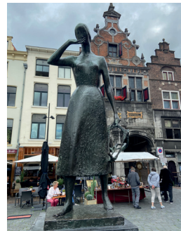
kunstenaar: Vera van Hasselt titel: Mariken van Nieumeghen jaartal: 1957 plaats: Grote Markt (2)

U bent op Plein 1944. De naam van dit plein verwijst naar het bombardement op 22 februari 1944. Een groot deel van het Nijmeegse centrum werd hierdoor getroffen en veel mensen kwamen hierbij om. Dit plein vormt het stedenbouwkundig hart van de wederopbouw in Nijmegen. Hier is een monument geplaatst ter herinnering aan de militairen die tijdens de Tweede Wereldoorlog sneuvelden. Het plein is opnieuw ingericht in 2010. Het beeld is toen in restauratie gegaan. De tufstenen uitvoering bleek te kwetsbaar om weer buiten te plaatsen. Het is vervangen door een replica in brons.