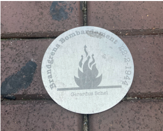
titel: De Brandgrens jaartal: 2019 plaats: route door het centrum

Daar steekt u over naar de winkelrij. Voor de gevels vindt u in de grond een serie gedenkplaatjes 'Brandgrens bombardement 22-2-1944', met steeds een andere naam van een slachtoffer erop. 800 plaatjes markeren de 2,5 kilometer lange brandgrens van het gebied in de binnenstad dat in 1944 vrijwel volledig werd weggevaagd.