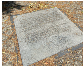
kunstenaar: Onbekend titel: Afdeksteen tijdscapsule jaartal: 1974 plaats: Hunnerpark (6)

Loop dit pad naar rechts af en blijf in het park door voor de straat linksaf het pad te nemen. Volg het pad langs het beeld van Petrus Canisius en loop door naar de rand van het park, naar de ruimte die door lage muurtjes wordt omsloten. Hier bevindt zich een afdeksteen met daaronder een tijdscapsule met daarin historische documenten die betrekking hebben op Operatie Market Garden in 1944. De capsule werd op 18 september 1974 begraven in aanwezigheid van Koningin Juliana en verschillende legerleiders en zal worden geopend in het jaar 2044.