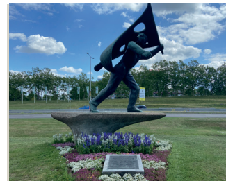
kunstenaar: Marius van Beek titel: Verzetsmonument jaartal: 1954 plaats: Keizer Traianusplein (7)

Vanaf dit punt kijkt u op het drukke verkeersplein het Keizer Traianusplein. Rechts in de grasstrook tussen de drukke wegen in ziet u het verzetsmonument van Marius van Beek. U kunt niet bij dit beeld komen.