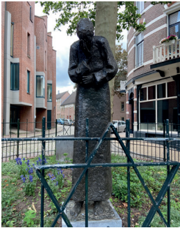
kunstenaar: Paul de Swaaf titel: Joods monument jaartal: 1995 plaats: Kitty de Wijzeplaats (4)

een beeld dat is ontworpen door Paul de Swaaf. Het houdt de herinnering in leven aan alle in de Tweede Wereldoorlog omgekomen Nijmeegse joden.