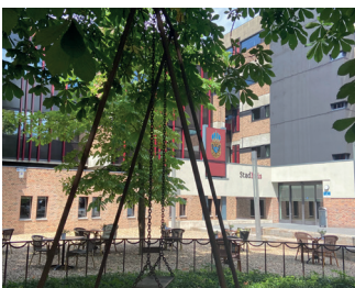
kunstenaar: Henk Visch titel: De Schommel jaartal: 2000 plaats: Raadhuis (5)

U gaat linksaf en volgt de Burchtstraat. Tegenover huisnummer 53a, gaat u rechtsaf de Marikenstraat in. Halverwege, aan de rechterkant, ter hoogte van het stadhuis, ziet u onder de bomen De Schommel, het kunstwerk van Henk Visch. Het staat op de plek waar tijdens het bombardement een school is geraakt waardoor 24 kinderen en 8 zusters omkwamen.