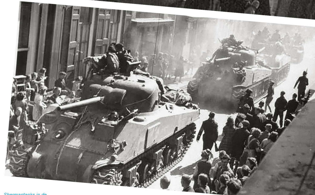
Shermantanks in de Vischpoortstraat in Elburg