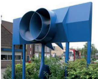
titel: Blauwe Fontein, Stroming jaartal: 1988 plaats: Groenestraat 336 (10)

U fietst langs het Goffertpark de Rentmeesterlaan uit tot aan de Slotemaker de Bruineweg. Daar gaat u linksaf. Direct daarna slaat u rechtsaf de Wezenlaan in. Fiets deze helemaal uit tot aan de Groenestraat. Steek de kruising schuin links over en ga de Groenestraat in. Net achter de stoplichten van deze kruising, aan uw rechterhand staat op het bedrijfsterrein van Smit Transformatoren BV het beeld 'Blauwe Fontein, Stroming'.