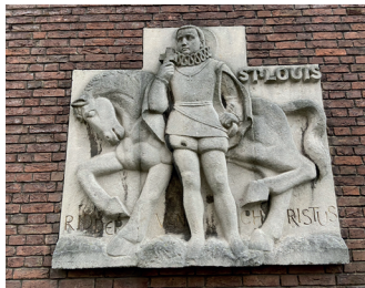
titel: Saint Louis jaartal: 1951 plaats: Bijleveldsingel 161-177 (3)

Ga rechtsaf via het fietspad en volg de parallelweg van de Sint Canisiussingel. Bij de derde kruising steekt u de weg over naar de Prins Bernardstraat, ga de eerste weg rechts, de Bijleveldsingel in. Aan de linkerkant, op nummer 161-177 ziet u in de muur het reliëf van St. Louis.