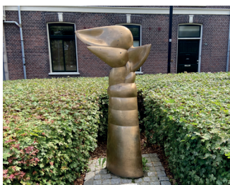
titel: De Gouden Engel jaartal: 1980 plaats: Parkweg/Pijkestraat (12)

Fiets terug naar de kruising, ga een stukje terug de Doctor de Blécourtstraat in en sla de eerste weg linksaf de Kerkstraat in. Ga aan het einde van de Kerkstraat rechtsaf door de Korte Bredestraat, dan de derde straat rechts de Schependomlaan in, door het oude dorp Hees. De Schependomlaan fietst u helemaal uit. Op het kruispunt met de Dikkeboomweg gaat u rechtdoor de Tweede Oude Heselaan in. Bij het grote kruispunt met 6 wegen slaat u schuin links de Krayenhofflaan in. Aan het einde, gaat u bij de kruising rechtsaf de Voorstads- laan in, richting centrum. Onder de Hezelpoort door ziet u rechts al gauw het Kronenburgerpark. Rij rechtdoor en ga met een bocht naar rechts omhoog de Parkweg in, volg deze met het park aan uw rechterkant. Bij de eerste splitsing van de weg, de kruising met de Pijkestraat, staat het beeld 'De Gouden Engel' tussen de struiken.