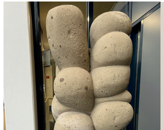
titel: Nature Vivante jaartal: 1975 plaats: Professor Bellefroidstraat 11 (8)

Fiets verder op de Heyendaalseweg en sla op de rotonde rechtsaf de Groenewoudeweg in. Bij het kruispunt met verkeerslichten linksaf de Professor Bellefroidstraat in. Hier ziet u aan uw rechterkant de brandweerkazerne. Bij de ingang ziet u Nature Vivante.