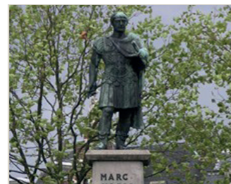
kunstenaar: Charles Hammes en Ed van Teeseling titel: Keizer Traianus jaartal: 1956 plaats: Keizer Traianusplein (2)

U fietst de Sint Anthoniusplaats uit en slaat linksaf de Ridderstraat in. Volg aan het einde de weg naar rechts en ga weer aan het einde, met de bocht mee naar links Kelfkensbos in, u fiets daarmee om het plein met het Museum Het Valkhof. Fiets rechtdoor door de Sint Jorisstraat en kom uit op het Keizer Traianusplein, daar ziet u links het beeld van Keizer Traianus staan.