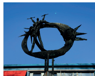
titel: Mens in zijn wereld jaartal: 1964 plaats: Hatertseweg 400 (9)

Aan het eind van de Professor Bellefroidstraat rechtsaf de Heyendaalseweg op. U komt langs de gebouwen van de Radboud Universiteit. Na de sportvelden aan de linkerkant, gaat u op de kruising rechtsaf de Houtlaan in. Als de Houtlaan bijna aan het einde naar rechts buigt, steekt u schuin links over om via het fietspad het laatste stukje van de Houtlaan uit te rijden tot aan de kruising met de Sint Annastraat. Steek deze voorzichtig over en ga linksaf over de parallelweg. Fiets een stukje door en neem de eerste weg rechts, de Heiweg. Deze fietst u helemaal uit tot aan de Hatertseweg. Steek deze over, een klein stukje naar rechts, bij de Technische School op nummer 400 staat 'Mens in zijn wereld'.