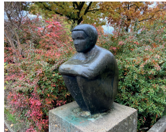
titel: Zittend kind jaartal: 1969 plaats: Heyendaalseweg/ Professor Huijbersstraat (7)

Fiets een stukje terug over de Archipelstraat naar de stoplichten en ga daar rechtsaf de Heyendaalseweg op. Op de hoek met de tweede straat aan uw rechterhand, de Professor Huijbersstraat, ziet u voor de school het beeld 'Zittend kind'.