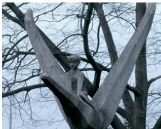
titel: Nils Holgersson jaartal: 1960 plaats: Energieweg 93 (11)

Fiets de Groenestraat verder af en passeer de spoorwegovergang. U rijdt bij de stoplichten rechtdoor en fietst naar beneden de Wolfkuilseweg in. Bij de stoplichten gaat u linksaf. U fietst nu op de Oude Graafseweg. Deze gaat aan het einde over in een fietspad, langs de grote weg. De eerste kruising is bij de Dennenstraat. Daar gaat u rechtsaf. Fiets naar beneden, de straat gaat over in de Doctor de Blécourtstraat en komt uiteindelijk uit op de kruising met de Energieweg. Hier gaat u een klein stukje naar links, blijf aan deze kant van de weg. Op nummer 93 komt u bij het Dominicus College. Op het voorplein ziet u achter het hek 'Nils Holgersson'.