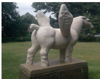
titel: Pegasus jaartal: 1965 Plaats: Berg en Dalseweg/ Hengstdalseweg (5)

Ga terug door het hek, ga rechtsaf en volg de rijrichting. Nu fietst u al snel naar beneden en komt weer uit op de oprit naar de Berg en Dalseweg. Aan de overkant, in het plantsoen, staat het beeld 'Pegasus'.