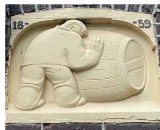
titel: Reliëf (Man die ton rolt) jaartal: 1947 plaats: Sint Anthoniusplaats 13 (1)

Op de Sint Anthoniusplaats, boven de deur van nummer 13 ziet u de gevelsteen 'Man die ton rolt'. Dit is een van de eerste werken van Ed van Teeseling, in opdracht van 'Broekkamp's Wijnhandel' in 1947.