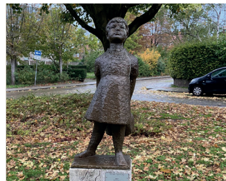
titel: Meisje met schooltas jaartal: 1959 plaats: Archipelstraat/ Atjehstraat (6)

Fiets rechts om het plantsoen heen, aan de andere kant komt u op de Hengstdalseweg, fiets deze omlaag en ga alsmaar rechtdoor. De weg gaat over in de Van 't Santstraat. U blijft de weg volgen. Deze maakt een flauwe bocht naar links en heet vanaf daar Koolemans Beijnenstraat. Steek de Groesbeekseweg over, fiets weer rechtdoor en volg de Archipelstraat. Nadat u bij de stoplichten de Heyendaalseweg oversteekt komt u bij de derde straat rechts op een grasveld, dit is de hoek met de Atjehstraat. U bent bij het 'Meisje met schooltas' aangekomen.