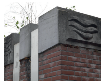
titel: Twee reliëfs jaartal: 1982 plaats: Grotestraat/Waalkade (14)

Fiets rechtsaf de Waalkade op met de muur aan uw rechterzijde. In de doorgang naar de Grotestraat bevinden zich de laatste twee kunstwerken van de Ed van Teeselingroute.