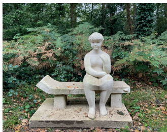
titel: Kind op bank jaartal: 1961 plaats: Hengstdal Ubbergen, voorplein Sint Maartensschool (4)

De weg stijgt en u klimt verder omhoog tot u bij de afslag naar de Sint Maartenskliniek komt. Daar gaat u linksaf het terrein van de kliniek op. U volgt de weg rechtsom, deze leidt u in een rondje terug naar deze plek. Het rondje is zwaar trappen, u kunt het eerste stuk ook even omhoog lopen. In de bocht van de weg kunt u rechtsaf, als het hek open is, richting de St. Maartensschool. Volg het pad en vind aan uw rechterhand het beeld 'Kind op bank'.