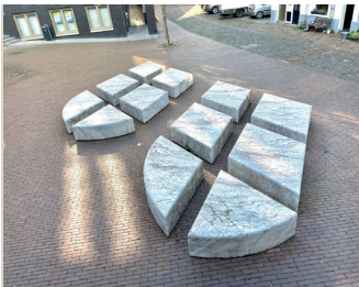
kunstenaar: Marinus Boezem titel: Lichtsculptuur jaartal: 2010 plaats: Gebroeders van Limburgplein (13)

Loop het pleintje over, langs de Sint Jacobskapel en ga linksom de steeg Glashuis in. Kijk tegenover de kapel vooral even naar de gevel van het vogelhofje, met de vele vogelhuisjes. U loopt terug naar de Lange Hezelstraat. Steek deze over en loop de Pijkestraat in. U passeert daarbij het nieuwbouwproject de Hessenberg. Als u interesse heeft in architectuur loop dan even rond over het voormalige Gelderlandterrein, waar tussen 2005 en 2008 190 woningen werden gerealiseerd. Op het Gebroeders van Limburgplein zult u 'Lichtsculptuur' ontdekken.