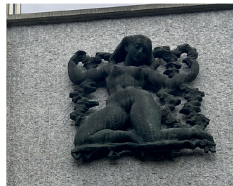
kunstenaar: Pieter Starreveld titel: De mens en de vier elementen jaartal: 1967 plaats: Kronenburgersingel 269 (19)

Ga terug naar het park en met het park nog steeds aan uw linkerhand gaat u de Kronenburgersingel in. Aan de overkant, in de gevel van de voormalige School voor Ambachtsonderwijs (Kronenburgersingel 269), bevinden zich reliefs.