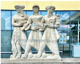
kunstenaar: Jo Uiterwaal titel: Drie staande figuren jaartal: 1953 plaats: Stationsplein (22)

Als u recht voor het station staat, ziet u links naast de hoofdingang het beeld 'Drie staande figuren', van Jo Uiterwaal.