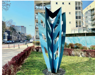
kunstenaar: Dicky Brand titel: Boom van Dicky jaartal: 1992 plaats: Kronenburgersingel (20)

Ga rechts de Stieltjesstraat in, richting het station. U passeert de 'Boom van Dicky'.