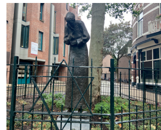
kunstenaar: Paul de Swaaf titel: Joods monument jaartal: 1995 plaats: Kitty de Wijzeplaats (9)

Terug naar de Smidstraat ziet u aan uw linkerhand de Kitty de Wijzeplaats. Midden op dit pleintje staat het 'Joods monument' in de vorm van een treurende vrouw, deze wordt begeleid door een tekst van Leo Vroman.