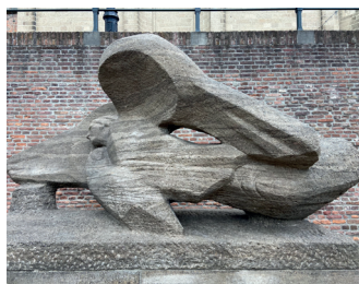
kunstenaar: Mari Andriessen titel: Monument voor de burgerslachtoffers van de Tweede Wereldoorlog jaartal: 1959 plaats: Sint Stevenskerkhof (6)

Loop verder links om de kerk en vind meteen rechts om de hoek het 'Monument voor de Burgerslachtoffers'.