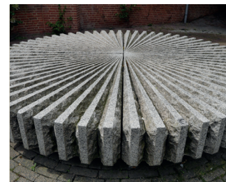
kunstenaar: Christiaan Paul Damsté titel: Omgevingsvormgeving jaartal: 1983 plaats: Smidstraat, binnenplaats onderaan de Petrus Canisiusschool (8)

Ga meteen daarna links de trappen af naar de Smidstraat. Rolstoelgebruikers kunnen teruggaan via de Grote Markt, rechtsaf de Stikke Hezelstraat omlaag, weer rechtsaf over de Ganzenheuvel. Deze loopt over in de Smidstraat, een klein stukje verder rechts komt u onderaan de trappen van de school op een binnenplaats. Hier staat een beeld van Paul Damsté.