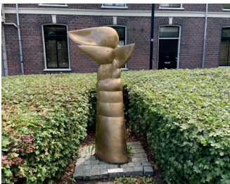
kunstenaar: Ed van Teeseling titel: De Gouden Engel jaartal: 1980 plaats: Parkweg/Pijkestraat (14)

Aan het einde van de Pijkestraat ziet u tussen de struiken 'De Gouden Engel'.