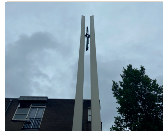
kunstenaar: Frans Verhaak titel: Plastiek jaartal: 1960 plaats: Kroonstraat 148 (16)

Steek het pleintje rechtsaf over. Tussen de 4 hoge palen, op 10 meter hoogte, bevindt zich een bronzen plastiek in de vorm van een machinegeweer. De mitrailleur is gericht op de Titus Brandsmakapel, de plek waar karmeliet Brandsma tijdens de Tweede Wereldoorlog door de Duitse bezetter werd opgepakt.