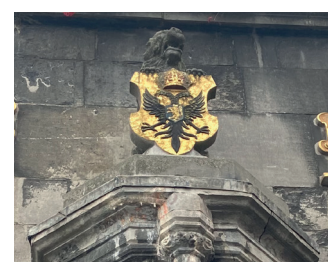
kunstenaar: Giuseppe Roverso titel: Leeuw jaartal: 1971 plaats: Grote Markt, in de kerkboog (3)

Loop naar de andere oude gevel, richting de bogen met de onderdoorgang naar het Sint Stevenskerkhof. Kijk omhoog en zie een leeuw met een gouden wapen, tegen de gevel boven de kerkboog.