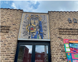
kunstenaar: Jan van Eijk titel: Moeder Gods jaartal: 1960 plaats: Kroonstraat 148, Titus Brandsma kapel (15)

Loop voor de engel linksaf de Kroonstraat in en kom na 50 meter bij de Titus Brandsma-kapel. Boven de ingang ziet u een kleurige mozaiek.