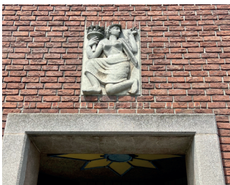
kunstenaar: Jo Uiterwaal titel: Twee reliëfs jaartal: 1953 plaats: Stationsplein (22)

Boven het portaal, achter het beeld ziet u twee reliëfs.