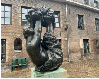
kunstenaar: P  p   Gregoire titel: Moeder en kind jaartal: 1981 plaats: Papengas (12)

Ga rechtsaf en volg de Lange Hezelstraat. Ga bij de tweede zijstraat rechtsaf, de Papengas in. Op het pleintje Glashuis staat het speelse beeld 'Moeder en Kind'.