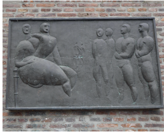
kunstenaar: Oscar Goedhart titel: Het raadsel van Nijmegen jaartal: 1974 plaats: Sint Stevenskerkhof (7)

Als u rechts met de bocht meeloopt passeert u de Petrus Canisiusschool. Tegenover de school hangt aan de hoge muur 'Het raadsel van Nijmegen'.