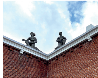
kunstenaar: Jo Uiterwaal titel: Twee knielende figuren jaartal: 1953 plaats: Stationsplein (23)

Wanneer u naar links kijkt, ziet u helemaal achteraan het plein, boven op de gevel 'Twee knielende figuren' van Jo Uiterwaal.