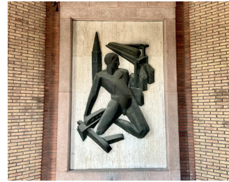
kunstenaar: Charles Hammes titel: Reliëf jaartal: 1955 plaats: Stationsplein (22)

In het portaal, afgesloten door een glaswand, zijn met ge-glazuurde bakstenen, sierlijke elementen aangebracht. Op het plafond ziet u een gietijzeren versiering in de vorm van een ster en tegen de achterwand een kunstwerk van Charles Hammes. De treinen en huizen wervelen op een speelse manier rondom de mannenfiguur.