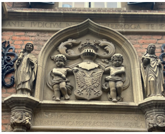
kunstenaar: Giuseppe Rovervo titel: Wapenreliëfs jaartal: 1965 plaats: Sint Stevenskerkhof 2 (4)

Op het Sint Stevenskerkhof ziet u aan uw linkerhand een van de oudste gebouwen van Nijmegen, de Latijnse School. Boven de ingang bevindt zich het wapen van Nijmegen dat door twee engeltjes wordt vastgehouden.