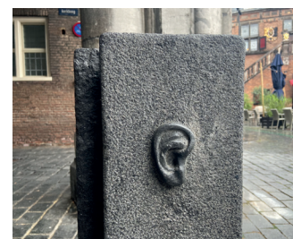
kunstenaar: Jerome Symons titel: Afsluitpaal jaartal: 1987 plaats: Grote Markt/Sint Stevenskerkhof (3)

Onder de linker toegangsboog ziet u een afsluitpaalpaaltje dat opvalt door de oren. Deze horen alles maar vertellen niets door.