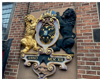
kunstenaar: Henri Leeuw sr. titel: Vier stadswapens jaartal: 1886 plaats: Grote markt, Waaggebouw (2)

U ziet op dit plein ook het levendige en rijk versierde Waaggebouw. Op de eerste verdieping zijn bij de toegangsdeur twee reliëfs geplaatst die elk twee leeuwen afbeelden die het stadswapen vasthouden.