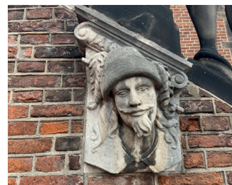
kunstenaar: Henri Leeuw sr. titel: Twee paar Karyatiden (kraagstenen) jaartal: 1886 plaats: Grote Markt, Waaggebouw (2)

Vlak onder de balustrade van de trappen ziet u twee keer twee beeldhouwde hoofden, op uitstekende stenen, dit zijn kraagstenen.