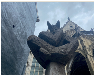
kunstenaar: Piet Killaars titel: Moenen jaartal: 1968 plaats: trappen Stikke Hezelstraat (5)

U kunt een bezoek brengen aan de Sint Stevenskerk. De openingstijden kunt u vinden op www.stevenskerk.nl . Op de trappen naar de Stikke Hezelstraat, tegenover de hoofdingang van de kerk, zit grijnzend op een paal, de kwaadaardige Moenen, de duivel uit het verhaal van Mariken van Nieumeghen.