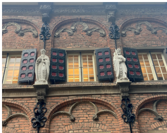
kunstenaar: Giuseppe Rovervo titel: Apostelcyclus jaartal: 2017 plaats: Sint Stevenskerkhof 2 (4)

Verspreid over de hele gevel zijn de twaalf apostelen afgebeeld, met hun namen onder hun voeten.