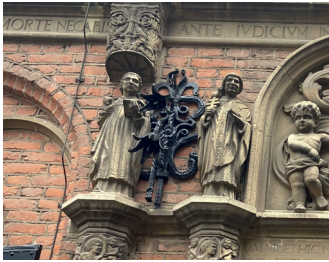
kunstenaar: Giuseppe Rovervo titel: Vier Kerkvaders jaartal: 1961 plaats: Sint Stevenskerkhof 2 (4)

Aan beide kanten naast de engeltjes, zijn de vier kerkvaders afgebeeld.