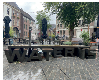
kunstenaar: Marc Ruygrok titel: WAT-ER-IS jaartal: 2000 plaats: Ganzenheuvel/Hezelstraat (11)

Loop door tot het waterkunstwerk 'WAT-ER-IS'.