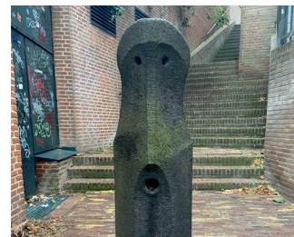
kunstenaar: Klaus van de Locht titel: Afsluitpaal 'Habakuk' jaartal: 1987 plaats: Noorderkerktrappen (10)

De wandeling loopt verder omhoog richting de Ganzenheuvel. Werp een blik naar links, bij de Noorderkerktrappen ziet u weer een afsluitpaaltje.