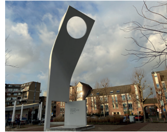
kunstenaar: Bas Maters titel: Joris Ivens Monument jaartal: 1990 plaats: Joris Ivensplein (17)

Loop rechtsaf Doddendaal af, terug richting de engel. Loop door over de Parkweg met aan uw linkerzijde het Kronenburgerpark. U komt op het Joris Ivensplein met het kunstwerk van Bas Maters.