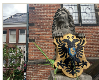
kunstenaar: Henri Leeuw sr. titel: Vier leeuwen jaartal: 1886 plaats: Grote Markt, Waaggebouw (2)

De balustrade van de grote trappen voor de gevel, wordt op vier punten bekroond met een wapendragende leeuw.