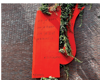
kunstenaar: Klaas Gubbels titel: Koffiepot jaartal: 2018 plaats: Arsenaalplaats (9)

Loop rechtdoor Klein Mariënborg uit naar het Hertogplein met in het midden de Wilhelminaboom. Op de hoek van het grasveld, links van de boom staat de 'Korfmaker'. Uitleg over dit beeld en over de stadsmuur en stadspoort op dit plein kunt u lezen op het informatiebord, een stukje naar rechts bij de gemetselde muur.