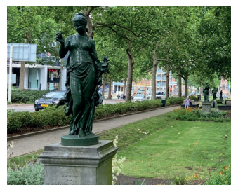
kunstenaar: Mathurin Moreau titel: Vier jaargetijden jaartal: 1889 plaats: Nassausingel (5)

In het groen van de Nassausingel staan de 'Vier jaargetijden'.