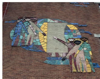
kunstenaar: Hendrik Meek titel: Symbool van Communicatie jaartal: 1972 plaats: Mariënborg 85 (10)

U loopt de Bisschop Hamerstraat in, die gaat bij het voetgangersgebied over in de Molenstraat. Aan de linkerkant, op nummer 122, bevindt zich het geboortehuis van Bisschop Hamer.