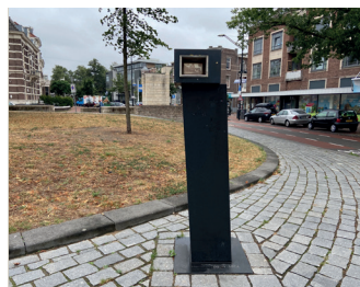
kunstenaar: stichting NOX titel: Korfmaker jaartal: 2008 plaats: Hertogplein (13)

De nieuwste gebouwen aan dit bijzondere plein zijn van de architect Jos van Eldonk. Zij vormen de wanden recht voor u en links van het plein. Aan uw rechterhand ziet u tegenover het plein de ingang van de parkeergarage. Op de zijwand links voor de ingang zit in de gevel het ozaïek met de titel 'Symbool van Communicatie'.