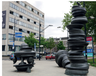
kunstenaar: Tony Cragg titel: Zonder titel jaartal: 1999 plaats: Stationsplein (1)

U steekt het stationsplein over naar het zwarte beeld op de rotonde voor het Stationsplein, dit is het beeld van Tony Cragg.