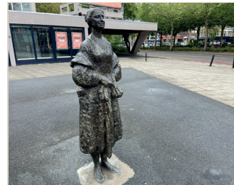
kunstenaar: Pieter d'Hont titel: Dame met stola jaartal: 1966 plaats: Nassausingel, plein stadsschouwburg (3)

Loop de Van Schaek Mathonsingel op, richting het Keizer Karelplein. Aan uw linkerhand staat op nummer 12 een grote villa met de letters 'Ned. Herv. Gemeente'. Aan de rechterkant, voor het trapje naar de ingang, ziet u tegen de gevel een reliëf van Pieter d'Hont.