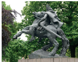
kunstenaar: Albert Termote titel: Karel de Grote jaartal: 1962 plaats: Keizer Karelplein (4)

Loop door op de singel richting het Keizer Karelplein. Vlak voor de rotonde loopt u links onder de stadsschouwburg door. Op het plein van de stadsschouwburg staat de 'Dame met Stola'.