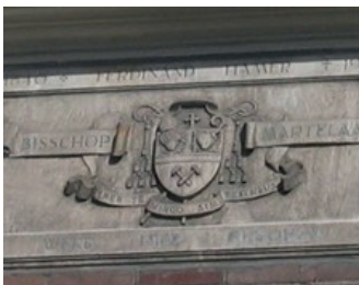
kunstenaar: Bernard Fokkinga titel: Plaquette jaartal: 1949 plaats: Molenstraat 122 (7)

U loopt tussen de bibliotheek en het poortgebouw waarin LUX is gevestigd door en verlaat het plein. U komt bij de Mariënborgsestraat. Aan de overkant ziet u een steeg met de naam De Spaarpot. Boven op de pilaren bij de ingang van de steeg ziet u twee spaarvarkentjes zitten.