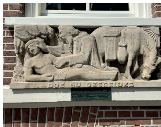
kunstenaar: Pieter d'Hont titel: De Barmhartige Samaritaan jaartal: 1949 plaats: Van Schaek Mathonsingel 12 (2)

Loop de Van Schaek Mathonsingel op, richting het Keizer Karelplein. Aan uw linkerhand staat op nummer 12 een grote villa met de letters 'Ned. Herv. Gemeente'. Aan de rechterkant, voor het trapje naar de ingang, ziet u tegen de gevel een reliëf van Pieter d'Hont.