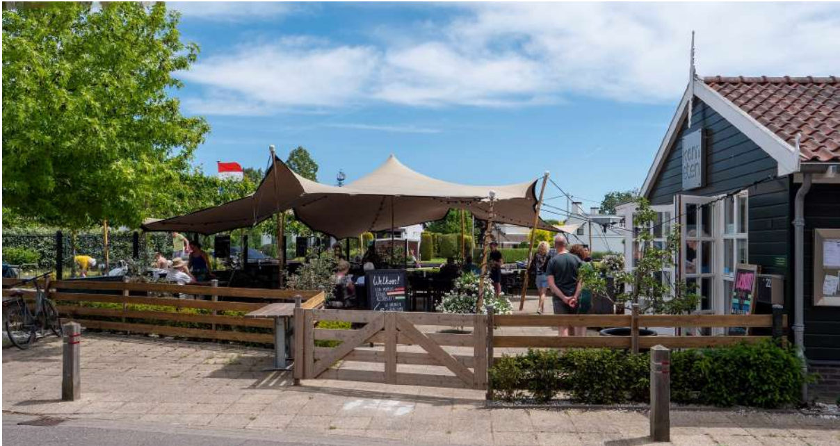
Kom Eten-terras Hoogmade

Tip: Links en rechts van de brug over de Does zijn heerlijke terrasjes om te genieten van de boten en bootjes in alle soorten en maten die de brug over deze levendige vaarweg naar Leiden passeren.