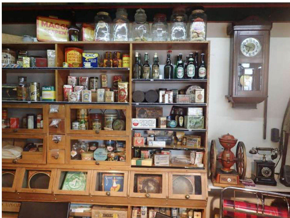
Historisch Museum Ter aar