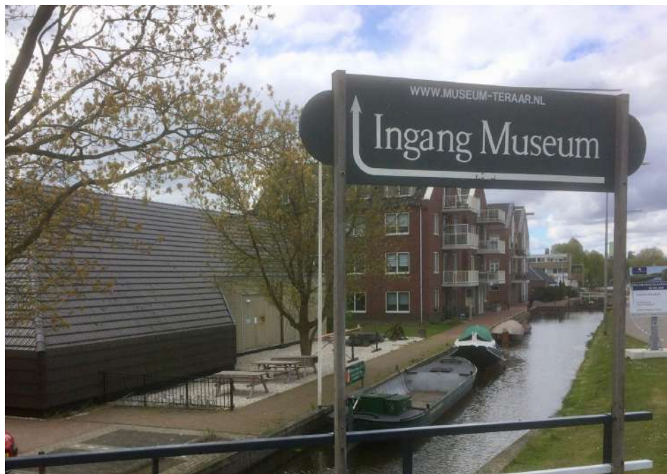
Historisch Museum Ter aar