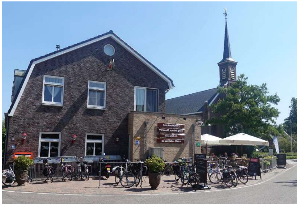
Langs de Meije