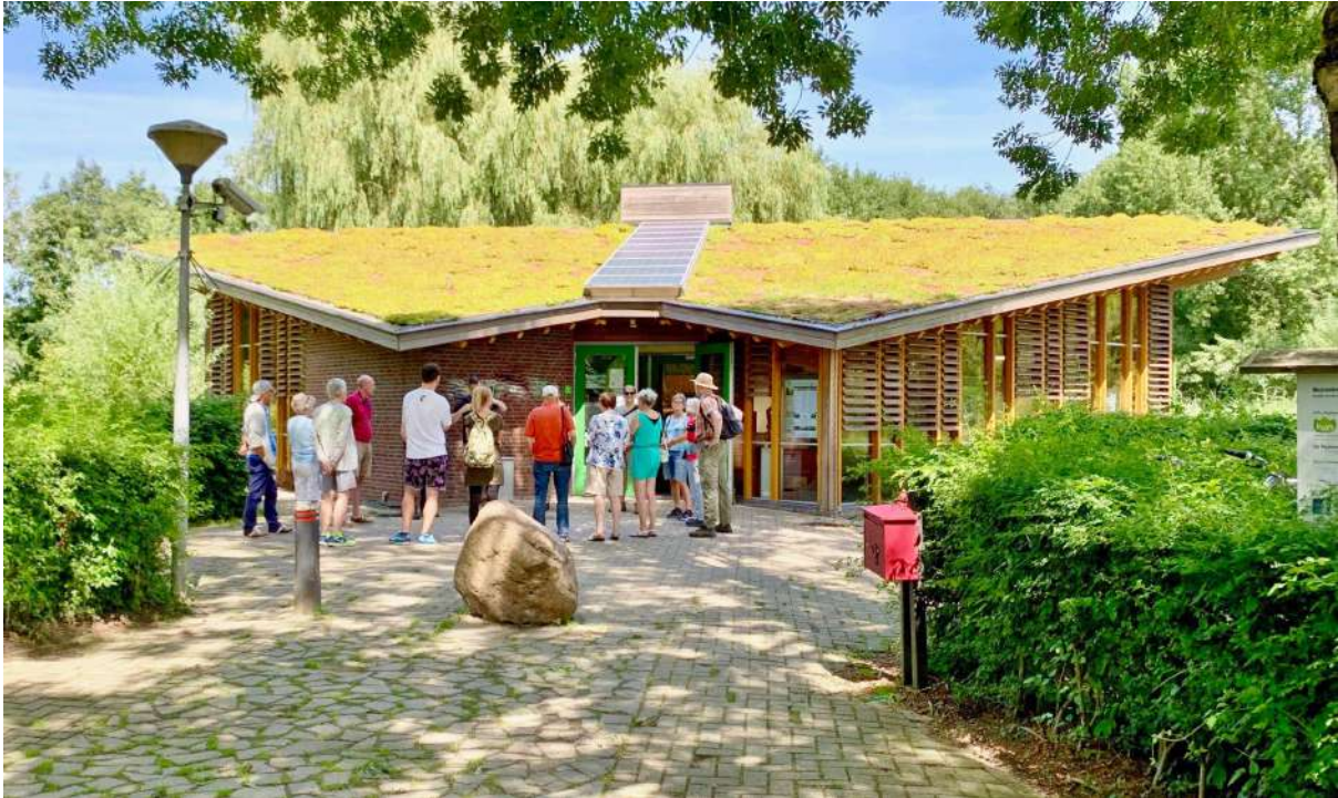
Bezoekerscentrum De Veenweiden

Toegangspoort naar de Rijn en Veenstreek