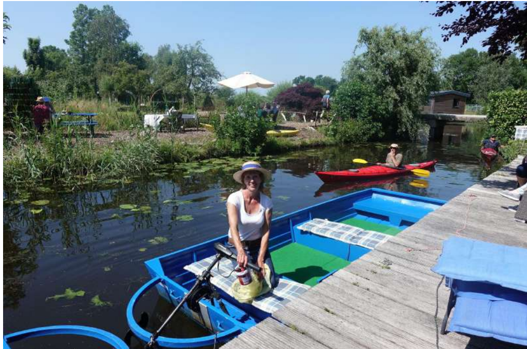
Langs de Meije

Een origineel veenriviertje in een oud-Hollands landschap