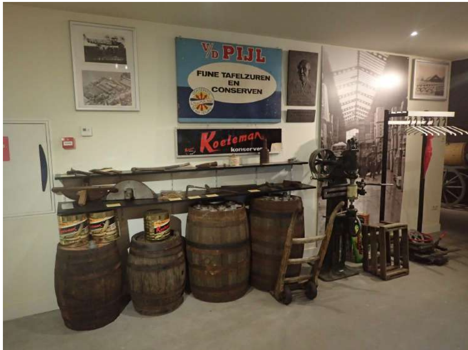
Historisch Museum Ter aar