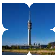
Voormalige PTT toren uit 1975 al jaren een herkenningspunt.