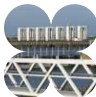
Het sluiscomplex 'de Houtribsluizen' werd geopend in 1975.