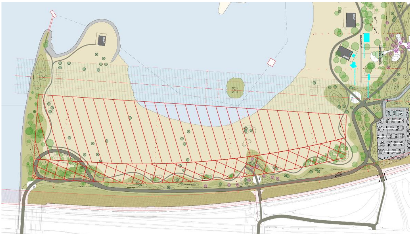
Afbeelding 1: Overzichtskaart zone voor evenementen

NB: Omdat in 2023 de zone voor evenementen op het Almeerderstrand voor het eerst in gebruik genomen wordt, zullen er in aanloop naar de evenementen nog veel vragen opkomen. Dit handboek zal dan ook gedurende 2023 in conceptvorm blijven. Voornemens is om dit handboek elke maand te updaten in aanloop naar de (grote) evenementen om de meest recente informatie n.a.v. vragen en nieuwe inzichten voor organisatoren toegankelijk te maken. Dit handboek is daarmee bedoeld als hulpmiddel en kent geen juridische status. Om die reden kunnen geen rechten ontleend worden aan dit handboek.