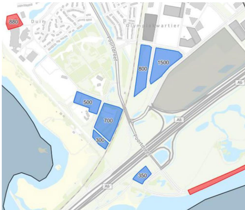
Afbeelding 3: beschikbare parkeerplaatsen in 2023