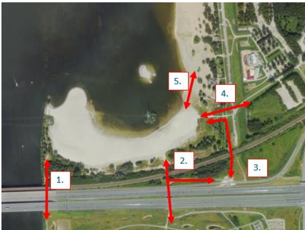
Afbeelding 2: ontsluiting zone voor evenementen