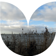
In 1995 werd 36,8 ha van het natuurgebied aangemerkt als bosreservaat.

1 De route start vanaf de parkeerplaats bij Tom's Creek. Ga vanaf parkeerplaats bij Tom's Creek RA en direct LA langs de afsluitbalk het bos in. Sla de eerste bosweg LA en daarna LA een betonfietspad op. Steek de asfaltweg (Buizerdweg) over en ga RD over de asfaltweg langs de parkeerplaats. Ga RD bij de afsluitbalk. Daarna RA en volg een breed grindpad. Sla in de bocht RA en volg het betonfietspad. Sla vóór de flauwe bocht LA en volg nu een breed graspad. Aan het eind RD over een betonfietspad. Ga na de bocht LA en volg het graspad door bos (wit-rode markering). Ga aan het einde RA en volg een breed graspad en ga dan RD over een betonpad. Daarna