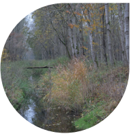
Met ca. 900 ha. het grootste bos van Lelystad.

Met deze wandeling maak je een heerlijke tocht door het Hollandse Hout. Een schitterend natuurgebied van maar liefst 900 hectare bij de Oostvaardersplassen. Het gebied werd na het opspuiten van Flevoland in de jaren 1972/1973 beplant met voornamelijk populieren, wilgen en elzen. Bomen die erom bekend staan dat deze snel groeien. Een ander deel van het gebied zou in eerste instantie een woonwijk worden. Deze woonwijk kwam er uiteindelijk niet en op deze plek werden langzamer groeiende bomen geplant, zoals eiken en beuken. Zo ontstond een natuurgebied waar indrukwekkende dieren zoals de torenvalk, boommarter en ringslang (niet giftig!) hun thuis hebben gevonden.