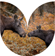
In Natuurpark Lelystad kun je de Big Five van Flevoland spotten.

Met deze route maak je een wandeling naar en in Natuurpark Lelystad. Dit bijzondere natuurgebied ligt aan de rand van Lelystad en werd in 1972 aangelegd als buitenverblijf voor de grote hoefdieren van Artis. Het park bood voldoende ruimte voor fokprogramma's voor bedreigde dieren. In Natuurpark Lelystad wemelt het van de indrukwekkende dieren. Van ooievaars tot otters en je kunt er zelfs de Big Five van Flevoland spotten! Het dorp Swifterkamp ademt de steen uit van lang vervlogen tijden. Welke dieren dit zijn, ontdek je vanzelf tijdens de wandeling. Hou je ogen open! Onderweg kom je ook nog langs Archeologisch Openluchtmuseum Swifterkamp.