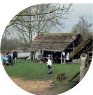
Het Swifterkamp ademt de sfeer uit van lang vervlogen tijden.

1 Loop vanaf de parkeerplaats richting het bezoekerscentrum en sla direct RA en volg klinkerweg met bocht naar links en rechts. Ga na restaurant De Waterlely RD en vóór de bocht LA over graspad langs water (Waterpad). Hou bij de picknickbank links aan en vervolg het graspad. Aan het eind LA over asfaltpad en direct in bocht RD over graspad langs het water. Ga aan het eind LA over asfaltpad op en verderop LA het graspad. Blijf nu dit pad langs de waterkant volgen. Het pad buigt van het water af, ga dan LA langs de afrastering. Aan het einde RA de asfaltweg op en na 50 meter LA . Ga twee keer RD over wildroosters en dan bij paal 5 LA en bij paal 6 RA . Sla dan het eerste graspad LA en direct RA langs afrastering. Aan