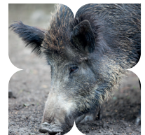
Het zichtvermogen van het wild zwijn is relatief slecht. Ruiken kan hij als de beste.

Sla LA op de Y-splitsing en volg het gravelpad, daarna het schelpenpad. Bij het informatiebord start een korte route langs de prehistorische nederzetting. Ga LA naar het overkapte informatiebord en vóór dit bord RA tussen hekjes door en volg kronkelend paadje langs een hut. Blijf dit pad volgen tot de open plek, ga daar RA omhoog en volg het graspad LA naar beneden. Ga na het informatiebord LA over het schelpenpad. Ga aan het eind LA en volg het pad tot de parkeerplaats.