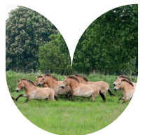
Het przewalskipaard is een ondersoort van het wilde paard.