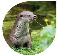
Otter gespot? Dat is best bijzonder, want otters zijn vaak alleen 's nachts actief.

uitkijkpunt. Na de brug RD het pad omhoog. Bovenaan ga je LA over het gras naar beneden en steek het schelpenpad over en volg je het graspad. Sla aan het eind LA en volg het schelpenpad. Ga bij paal 24 en 25 RD richting wilde zwijnen. Daarna bij paal 23 RA en direct LA langs afstering. Op kruising bij paal 38 RD , daarna RA bij paal 37.