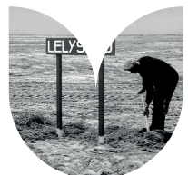
Revolutionair plan, de drooglegging van de polder.