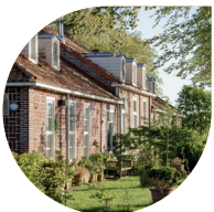
Het oudste stukje van Lelystad vind je hier in Lelystad Haven, voorheen Perceel P.

1 Loop vanaf bushalte Bataviahaven naar het water, sla RA en volg de waterkant en passeer de Batavia. Sla bij zes lage paaltjes in de stoep LA en passeer het bord '5,0t'. Voor het water RA over tegelpad en dan voor het hek RA over gras richting weg. Daar LA , volg klinkerpad langs de weg en ga na het viaduct RD over het schelpenpad. Aan het eind RA , direct LA en volg asphaltweg richting Parkhaven. Sla na bord '50 herhaling' RA en ga vóór de volgende bocht RA , het schelpenpad op. Hou na de speelplaats links aan en sla ca. 10 m na het zijpad links RA en volg het paadje tussen de struiken in de richting van de PTT-toren. Aan het eind RA , schelpenpad op. Daarna RD over fietsbrug en volg het fietspad. Steek de weg over naar fietspad Lommerrijk. Ga RA