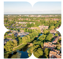
Lelystad is qua oppervlakte een van de grootste gemeenten in Nederland.

Ga RA over de fietsbrug en direct LA het onverharde pad op. Hou links aan op de Y-splitsing. Volg het pad tussen de struiken. Sla aan het eind LA , volg mulle zandpad en hou struiken aan linkerhand. Daarna RD tussen de struiken. Steek asfaltweg over en RD over pad tussen de struiken. Steek klinkerweg over, hou links aan, volg het fietspad en steek de weg over. Dan RA en volg het fietspad over de sluis. Ga bij bushalte RD over fietspad naar beneden. Ga RA op de kruising van fietspaden en door het tunneltje.