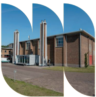
Het Gemeaal Wortman is gebouwd voor het leegpompen van de oostelijk Flevopolder.

Met deze route maak je een gevarieerde wandeling langs de Lelystadse kust en langs de randen van enkele woonwijken. Je passeert het roemruchte schip De Batavia, gaat door de duinen van Houtribhoogte en komt langs de wijken Golfpark, Boeier, Punter en Galjoen. Maar dat is niet alles. Via een strook duinbegroeiing achter de dijk loop je naar een van de belangrijkste punten in de geschiedenis van Lelystad: het voormalig Werkeiland. Dat is het begin van de Waterwandelpad, een educatieve route die vertelt over het ontstaan van Flevoland en die ons terugbrengt in Bataviahaven.