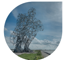
Exposure of de 'Hurlende man', het beeld van 26 m hoog bij het Bataviastrand.