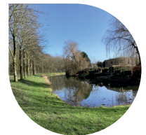
Het Gelderse Hout is in de beginjaren van Lelystad aangeplant.

Vóór parkeerplaats RA (vanaf parkeerplaats LA ), asfaltweg en direct LA asfaltfietspad op. RD over fietsbrug. Vóór bocht LA , pad langs sloot. Dan RA breed graspad op. Bij kruising van paden RA , breed bospad in. Eerste (brede) pad LA , daarna RD over fietspad. Steek RD klinkerweg over en ga RA vóór volkstuinen. Daarna RD over schelpenpad en na struiken LA over graspad voor sloot. Later RD over schelpenpad en buig met