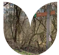
't Henkepad is ontstaan dankzij een ruimdenkende inwoner.