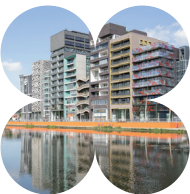
De Zilverparkkade is een mix van verschillende stijlen van verschillende architecten.

1 Steek met de vooringang van het NS-station in de rug RD het ‘gekleurde’ zebrapad over, richting centrum. Ga dan RA over de stoep langs het fietspad. Voor het water LA , de Zilverparkkade in. Aan het einde van de kade, bij de supermarkt steek je RD de weg over. Loop door de fietstunnel en vervolg route op de stoep. In de flauwe bocht ga je LA , steek je de weg over en ga je RD over de houten brug. Je bent nu in het Woldpark, een van de stadsparken van Lelystad.