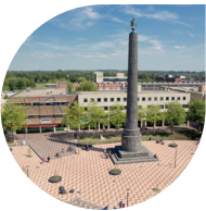
Lelystad, hoofdstad van Flevoland, dankt zijn naam aan ing. Lely.

Lelystad wordt omringd door een groene strook van parken, bossen en natuurgebieden. Op een aantal plaatsen dringt het groen diep door in de stad. Lelystad wordt niet voor niets ‘de hoofdstad van de nieuwe natuur’ genoemd. Dit maakt Lelystad een perfecte plek voor een lekkere, stevige wandeling zoals deze. Vanaf het NS-station loop je door het Woldpark en Woldbos naar het Gelderse Hout. Hier volg je ’t Henkepad (een mooi voorbeeld van het afwijken van de gebaande paden - scan de QR voor het verhaal achter dit pad), doorkruis je weer het Woldbos en via het Stadspark en de groene delen van de Atolwijk ga je terug naar het Stadshart.