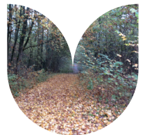
Het Bergbos is ontstaan uit een berg afval.