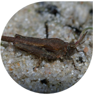
In Flevoland zijn veel verschillende sprinkhanen waargenomen.