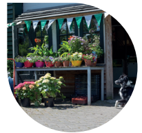
De Groene Velden, een uniek gebied in Lelystad.

2 Op de heuvel rechts aanhouden en daar naar beneden. Na de bocht ga je direct scherp LA , het bospad gaat daar over in een graspad. Aan het eind van het pad, ga je LA een asfaltpad op en in de bocht ga je RD een schelpenpad op (veldlooproute). Aan het eind ga je RA (veldlooproute) en volg je de bocht naar rechts. Daarna ga je LA , steek je de ruiterroute over en volg je het