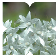
Het Stiltebos staat vol met stinzenplanten, prachtige wilde voorjaarsbloeiers.

ga je RA de trap op. Bovenaan ga je LA over het fietspad. Dit pad volgen tot na de fietsbrug op de kruising van fietspaden. Hier ga je LA over de stoep langs het fietspad en RA het tweede wandelpad op (zijpaden negeren). Vóór de woonhuizen ga je RA over het asfaltpad. Op de vijfssprong ga je links vooruit een breed tegelfietspad op (smal tegelpad links negeren) en RD over de Noorderwagenstraat. Bij kruisende asfaltweg ga je RD richting supermarkt.