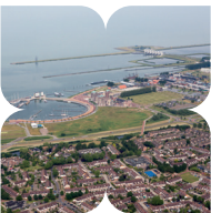
Lelystad heeft een oppervlakte van 765 km 2 , waaronder een wateroppervlakte van maar liefst 534 km 2 .

schelpenpad. In de bocht ga je RD over een graspad. Aan het einde ga je LA langs de bosrand. Daarna ga je RA de Chroomstraat in, dan direct RA de Kwikstraat in en RD langs de bosrand (Oostervaartbos).