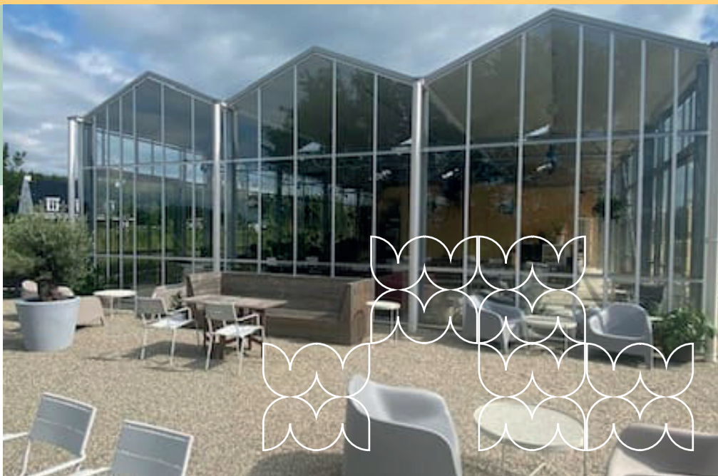
Onze Kas op de Groene Velden.

Na het viaduct ga je RA richting het centrum, over de brug en een betonfietspad. Na het oversteken van de weg, ga je RA over een tegelpad langs een ooievaarsnest. Met de bocht ga je naar rechts en dan LA via het schelpenpad het bos in (Stiltebos). Volg het pad (rechts en dan links) en aan het einde ga je RA . Op de Y-splitsing ga je LA en volg later de bocht naar links. Aan het einde ga je RD over een laaggelegen ijzeren brug en dan ga je RA langs de bosrand tot het einde. Daar ga je LA de asfaltweg op en voorbij de bocht