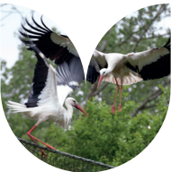
Ooievaars bouwen nesten in hoogspanningsmasten.