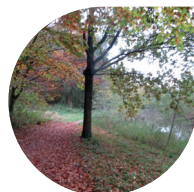
Het Bergbos is het hoogste bos van Lelystad en Flevoland.