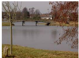
De visclub heeft aan de rand van Gemert een mooie plek om hun hobby uit te voeren.