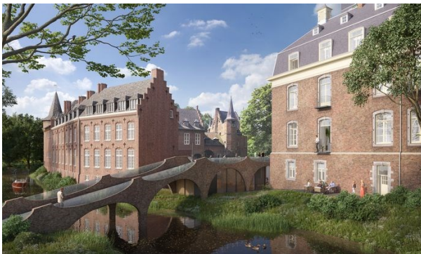
Een mooi begin op het Ridderplein tegenover het VVV-kantoor. Waar knooppunt 82 te vinden is.