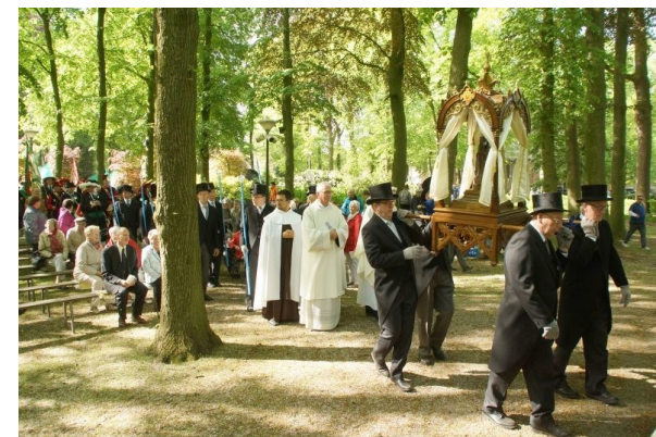
Ze komt dan ook langs de Kèskes die langs de hoofdweg van Gemert naar Handel staan.

Verder gaat de wandeling via Natuurcentrum De Specht door de bossen naar twee unieke bruggen. De langste ingeklemde composietbrug van Europa en tevens de eerste geprinte brug.