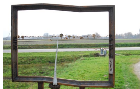
Langs de rand van Gemert staat een zichtraam dat je kan helpen om de plek van de breukrand te bepalen.

Door het buitengebied kom je bij De RooijePlas. Hier is een uniek waterskicentrum ontstaan nadat er zand en grind gewonnen is. Door de recente aanpassingen zijn er internationale wedstrijden mogelijk geworden. Van hieruit ga je naar het centrum van Handel En kom je langs een pluktuin en diverse horecagelegenheden.