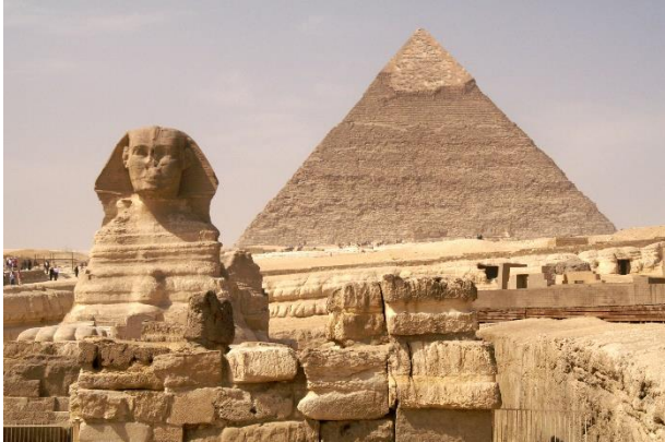
De Sfinx en de piramide van Cheops

We maken een stadswandeling door Caïro, bezoeken o.a. de Citadel, de Mohamed Ali moskee, Koptisch Caïro en het Egyptisch museum. Even buiten Caïro bezoeken we het plateau van Giza met de piramiden van Cheops, Chefrin en Mycerinus, ca.