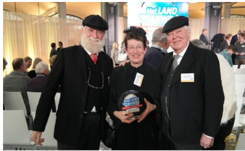
Leukste uitje van Noord-Brabant winnaar 2016

“Je knippert met je ogen en ineens sta je in een Brabants dorp van een eeuw geleden.”