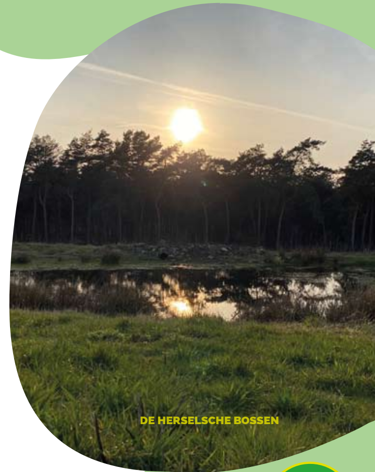
DE HERSELSCHE BOSSEN