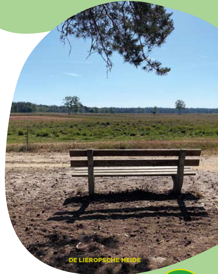
DE LIEROPSCHHE HEIDE