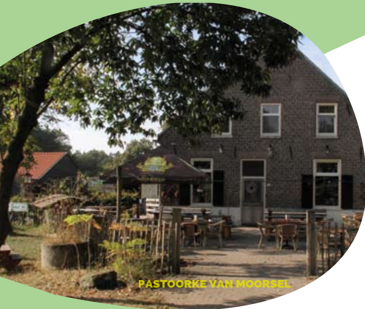
PASTOORKE VAN MOORSEL