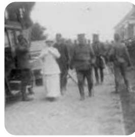
Koningin Wilhelmina bij Gastels Veer

Landgoed De Vliet (6) is een landgoed direct gelegen aan de Steenbergsche Vliet. Een belangrijk deel van het landgoed is bestemd voor natuurontwikkeling. Daarnaast is het landgoed zowel aan de oost- als westzijde deels openbaar toegankelijk gemaakt met de aanleg van wandelpaden, een kano- en vissteiger en een uitkijkpunt.