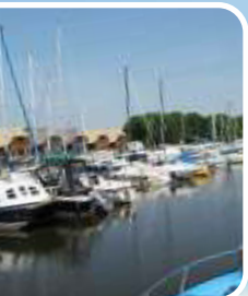
Jachthaven De Heen