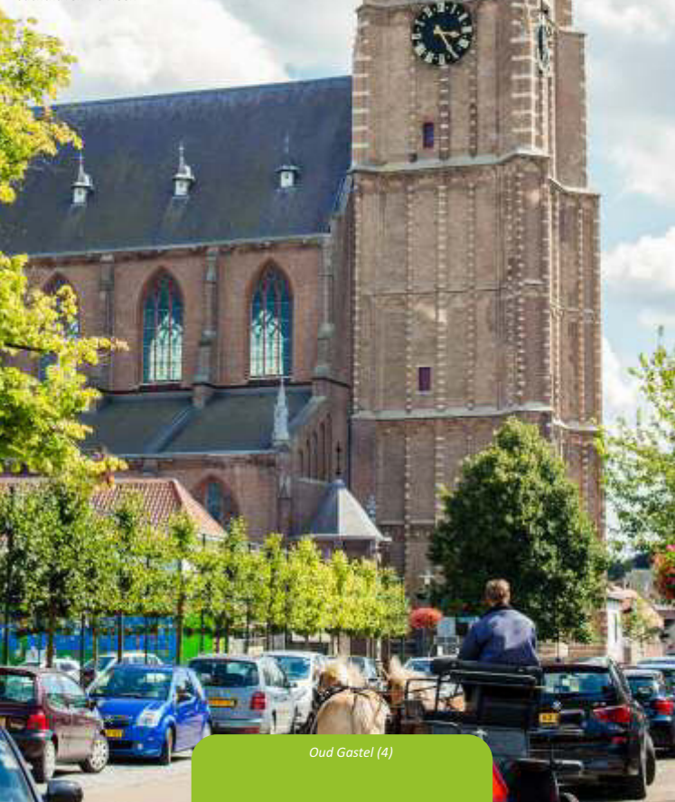
Oud Gastel (4)