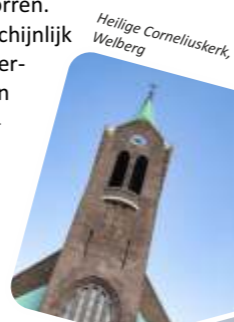
Heilige Corneliuskerk, Welberg

Blikvanger van de stad is de R.K. Sint Gummaruskerk. De kerk is ontworpen door Pierre Cuypers en gebouwd rond 1900. Ook de Nederlands Hervormde kerk, ook wel Witte Kerk genoemd, is een bezoek waard. Deze protestantse kerk is in 1831 gebouwd door het toenmalige ministerie van Waterstaat. In Steenbergen starten de wandelroutes* 'Vliegeniersroute', 'Vestingroute' en 'Historische Pandenwandeling', waarmee je een betere indruk kunt krijgen van het rijke verleden van Steenbergen.