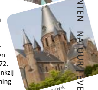
R.K. Gummaruskerk, Steenbergen

MONUMENTEN | NATUUR | EVENEMENTEN | WATER & RECREATIE