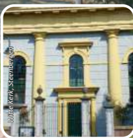
Witte Kerk, Steenbergen

MONUMENTEN | NATUUR | EVENEMENTEN | WATER & RECREATIE