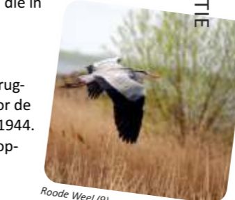
Roode Weel (9)