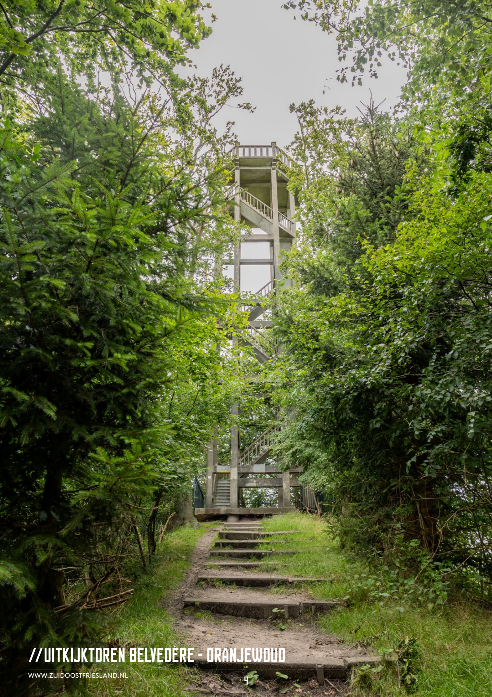
//UITKIJKTOREN BELVEDÈRE - ORANJEWOUD