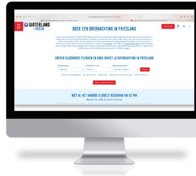
ZOEK EN BOEK (WATERLAND VAN FRIESLAND)

In de regio Waterland van Friesland (Zuidwest Fryslân) is een online Zoek & Boek module ontwikkeld die gekoppeld is aan de database (ODP) van de Friesland.nl website. Op deze manier zijn accommodaties in Zuidwest-Fryslân online boekbaar. VVV Waterland van Friesland wil dit ook faciliteren voor andere regio's. TRZF is in gesprek om deze samenwerking te bespreken. Op deze manier hoeft er in onze regio niet opnieuw een systeem ontwikkeld te worden, maar kunnen ondernemers wel profiteren.