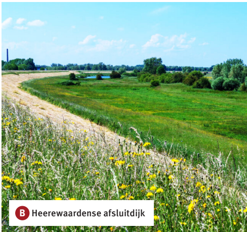
B Heerewaardense afsluitdijk

Vanuit het Bezoekerscentrum loop je langs het voetbalveld via MFC De Steen naar de Van Heemstraweg. Je steekt over en gaat op de dijk linksaf richting Rossum. Je loopt nu op de Heerewaardense afsluitdijk, de eerste en echte afsluitdijk van Nederland . Met deze dijk werd de verbinding tussen Maas en Waal definitief afgesloten. De afsluitdijk beschermt ook 's-Hertogenbosch en omgeving tegen de te hoge waterstanden van de Waal.