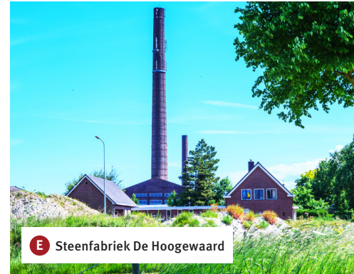
E Steenfabriek De Hoogewaard

De voormalige steenfabriek De Hoogewaard, gebouwd in 1869 als veldoven, werd later (1918) omgebouwd tot ringoven en in 1961 tot vlamoven. Alleen de toren van de oven is nog in originele staat.