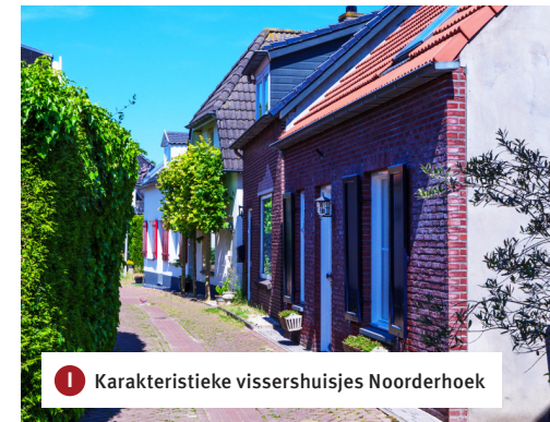
I Karakteristieke vissershuisjes Noorderhoek

Je keert weer terug naar de Hogestraat en loopt rechtsaf door naar de Noorderhoek. Aan deze straat liggen aan de rechterkant karakteristieke vissershuisjes . Vroeger kwamen de kotters in de wintermaanden terug uit Duitsland en werden ze in het Waalse gat in de achtertuin voor anker gelegd. Vervolgens sla je twee keer linksaf naar de Achterstraat en Variksestraat om rechtsaf via de Hogestraat weer terug te keren naar het bezoekerscentrum.