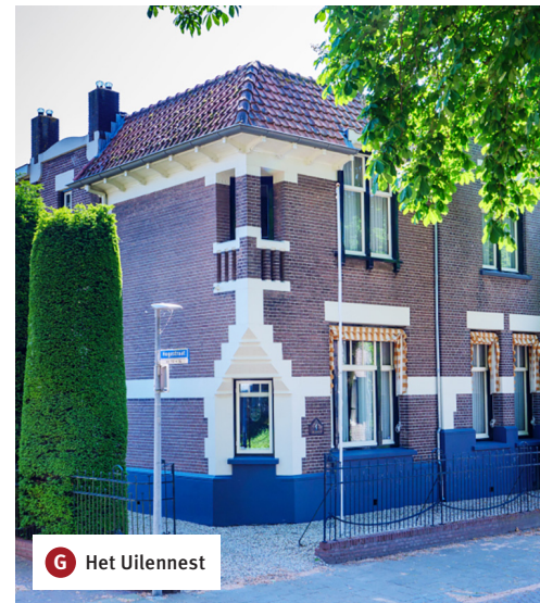
G Het Uilennest

Je loopt het dorp in. Aan de olopende weg is te merken dat het dorp op het hoogste punt in het landschap ligt. Tijdens het hoogwater van 1993-1995 was er geen gevaar voor de bewoners van Heerewaarden. Daardoor hoefde men niet te evacueren.