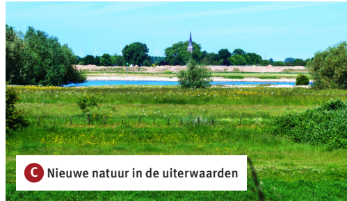
C Nieuwe natuur in de uiterwaarden