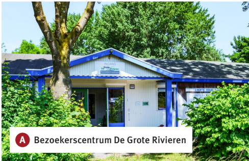
A Bezoekerscentrum De Grote Rivieren

De wandeling begint en eindigt bij Het Bezoekerscentrum De Grote Rivieren. In het bezoekerscentrum kun je terecht voor vaste tentoonstellingen en tijdelijke exposities, maar ook voor wandel- en fietsroutes in de omgeving. Verdiep je in de thema's van deze prachtige regio: rivieren en dijken, natuur en landschap, forten, archeologie, riviervisserij en de baksteenindustrie en ontdek welke rol dit gebied in de Zuiderwaterlinie heeft gespeeld.