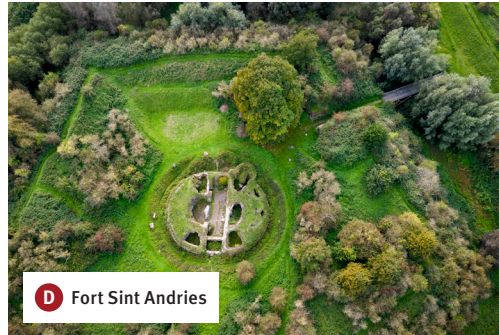
D Fort Sint Andries

In het plan Wamel, Dreumel, Heerewaarden worden de uiterwaarden op een natuurlijke manier met een geul heringericht om ruimte voor de rivier en nieuwe natuur te creëren. In de loop van 2025 zal met deze werkzaamheden worden begonnen.