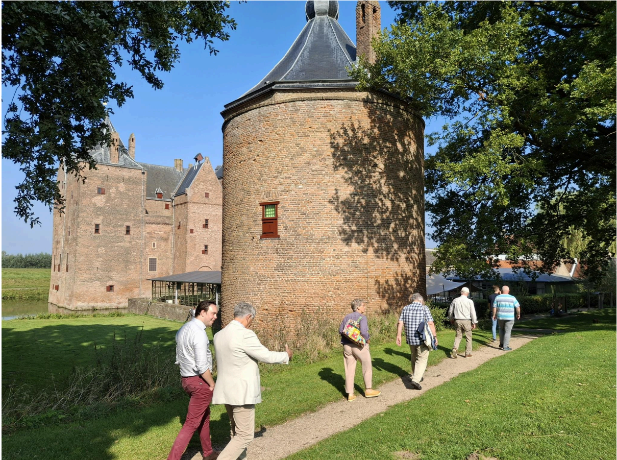
De rondleidingen werden verzorgd door deskundige gidsen van Slot Loevestein.