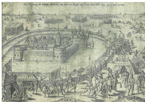
Vesting Wouw in 1583

Vanaf 2006 heeft Kees met een aantal anderen non-destructief onderzoek uitgevoerd om de kasteelresten in kaart te brengen. Uiteindelijk is er een stichting opgericht en vanaf 2016 zijn de fundamenten van het kasteel opgegraven door een grote groep vrijwilligers onder leiding van professionele archeologen. Vanaf 2018 zijn de indrukwekkende aarden vestingwallen en de gracht in samenspraak met de provincie, het waterschap en de gemeente weer teruggebracht in het landschap. De gracht vervult een waterbergende functie en rondom het kasteelterrein ligt een ecologische zone.