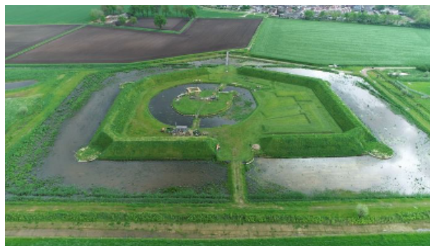
De gereconstrueerde vesting in 2024