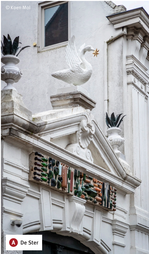
A De Ster

De Ster was vroeger de naam van een brouwerij die tot 1958 op de Wouwse Markt gevestigd was. De brouwerij op Markt 27 is te herkennen aan een witte inrijpoort met daarboven een zwaan die een ster in haar bek draagt. Die zwaan symboliseert de woning die de naam 'De Zwaan' droeg en de ster herinnert aan de naam van de brouwerij die regionaal een goede naam had. Boven de poort is een flessenmozaïek aangebracht. Een ontwerp van de Wouwse kunstenaar Kees Keijzer dat hij in 1960 maakte toen de brouwerij gesloten werd en het bedrijf als drankhandel verder ging.