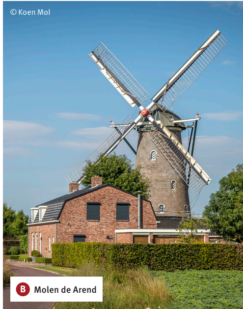
B Molen de Arend

Bergkorenmolen De Arend stamt uit 1811. Na een brand is de molen in 1825 herbouwd en nog steeds in functie. Op dinsdagen en zaterdag is een molenaar aanwezig. In de molenwinkel zijn meel, bloem, zaden, brood- en bakmixen te koop. Als de blauwe vlag op de molen wappert zijn bezoekers welkom.