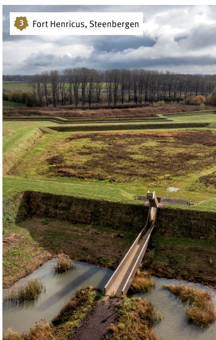
3 Fort Henricus, Steenbergen

Als je vanuit Steenbergen richting het Volkerak vaart, kom je al twee mooie Zuiderwaterlinie bezienswaardigheden tegen. Je passeert Fort Henricus 3, een van de grootste forten in het zuidwesten van de Republiek. Daarna vaar je door het Sluizencomplex Benedensas 4: een plek van historische waarde waar de thee bijna altijd klaarstaat in het veerhuis.