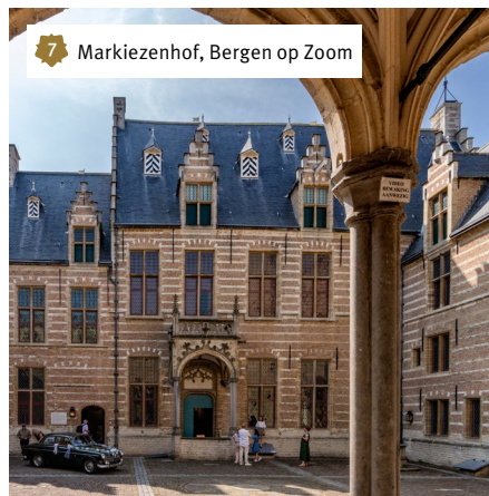
7 Markiezenhof, Bergen op Zoom