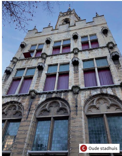
C Oude stadhuis

De oorsprong van deze kapel is te vinden in een oorkonde van 1312 toen Ewout Pieterszn. van Gabriele zijn huis aan de Kerkstraat beschikbaar stelde als onderdak aan arme reizigers. De huidige kapel is na de stadsbrand van 1452 gebouwd. Na de reformatie van 1577/1578 zijn het gasthuis en de kapel gebruikt voor opslag, onder meer van buskruit. Vermoedelijk als gevolg van de vele vluchtelingen uit de Zuidelijke Nederlanden in deze periode van de Tachtigjarige Oorlog is het gasthuis in 1583 weer als zodanig in gebruik genomen. Daarna werden ook zieke soldaten opgenomen. Uit vrees voor epidemieën verhuisde het gasthuis in 1631 naar een pand achter de Grote Kerk.