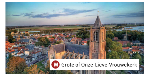
M Grote of Onze-Lieve-Vrouwekerk

De grotendeels in steen overwelfde kruisbasiliek in Brabants-Gotische trant bestaat uit een toren, een schip met zijbeuken, een transept en een niet voltooid koorpartij. Verder zijn er nog een noordportaal, librije en consistoriekamer aangebouwd. Met de bouw van het schip is men rond 1458 begonnen. Hierna is de uit de laatste helft van de 14e eeuw daterende toren verhoogd tot bijna 49 meter. In de toren hangen vier grote bronzen klokken. De drie oudste dateren van 1627.