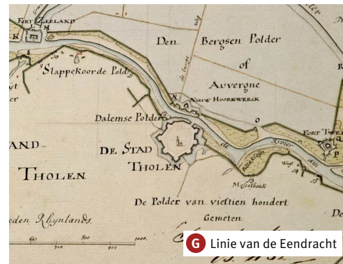
G Linie van de Eendracht

Reeds in 1373 werd een begin gemaakt met het inpolderen van de Deurloopolder. Ook deze polder heeft veel te lijden gehad van waterfloeden. In 1682 is de polder gedurende vier jaar onder water komen te staan. Helemaal op het uiterste punt ligt het zogenaamd Deurloo's kaadje. Hier was vroeger een landbouwhaventje waar suikerbieten in schepen werden ingeladen. Ten tijde van het begin van de Linie van de Eendracht is op deze plaats een redoute gevestigd.