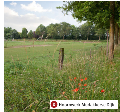
D Hoornwerk Mudakkerse Dijk

Hier rees in 2019 het natuurtheater-in-ording van kunstenaar Matthijs Bosman. La Damoiselle , vernoemd naar het zeventiende-eeuwse verdedigingswerk de Jufferschans, moet in 2029 zodanig begroeid zijn dat er op 14 september van dat jaar een toneelstuk over het beleg van Den Bosch opgevoerd zal worden.