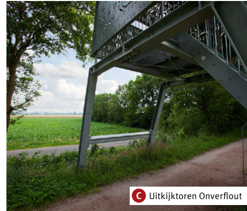
C Uitzichtoren Onverflout