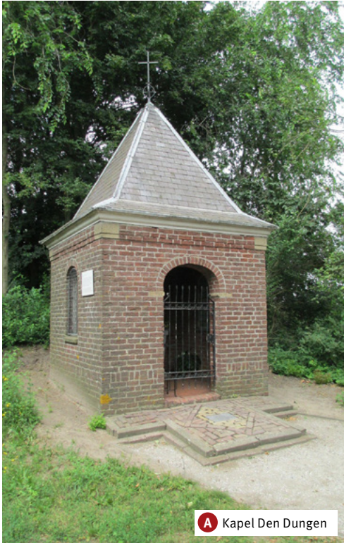
A Kapel Den Dungen