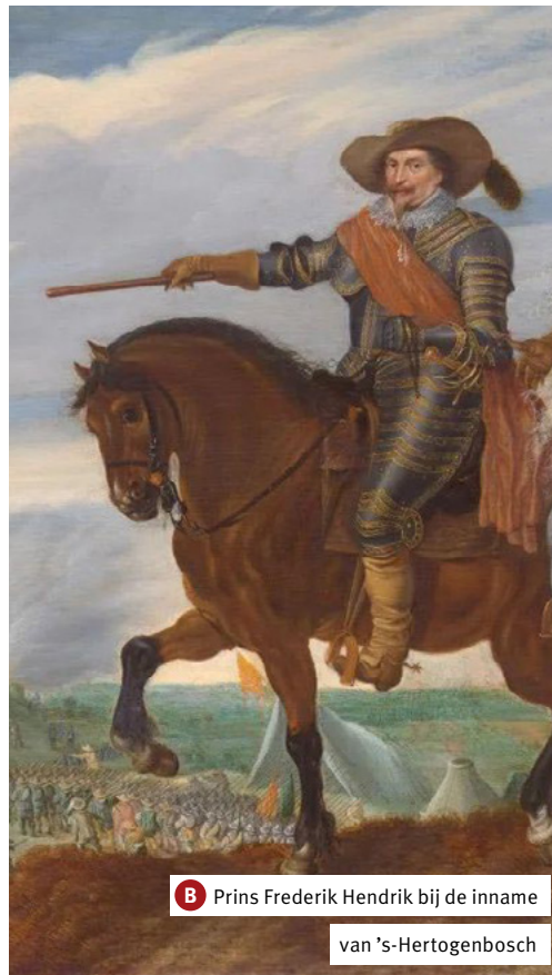
B Prins Frederik Hendrik bij de inname van 's-Hertogenbosch