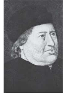
Jan van Glymes

Pas in 1926 werd Willemstad als vesting opgeheven. In 1970 is het oude stadje aangewezen als beschermd stadsgezicht en sindsdien trekt het historische Willemstad met haar jachthaven veel toeristen en dagrecreanten aan.