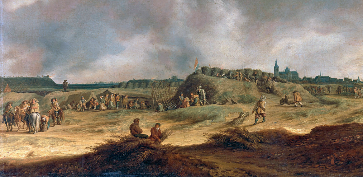
Het beleg van 's-Hertogenbosch in 1629: troepen van Frederik Hendrik bestoken vanaf een schans het Spaanse Fort Isabella