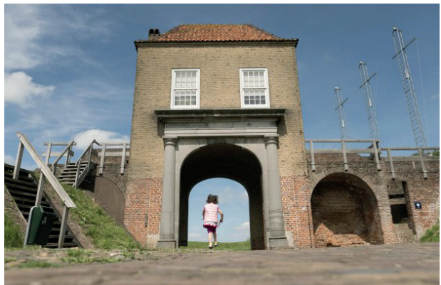
De Waterpoort aan de rivierzijde van Heusden

3 De fortificaties maakten van Heusden een onneembare vesting. Aanvallers moesten maar liefst twee wallen en twee grachten passeren. Nieuwsgierig? Ga dan in de Oudheusdensestraat na de bocht rechtsaf. Vanaf de omwalling brengt een wandelpad je naar de Bromsluis . De sluis diende als 'sortie', een tunnel onder de wal waardoor je een tegenaanval kon plaatsen of de vesting kon ontvluchten. Via een geheime doorwaardbare plaats in de gracht kwam je uit bij een ravelijn, een omwald eilandje. De sortie kon met een hekwerk worden geblokkeerd.