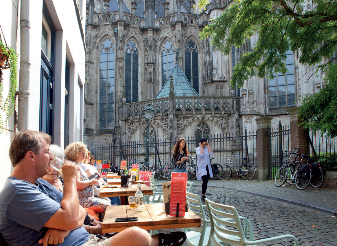
Dé plek om even te pauzeren: in de schaduw van de Sint-Jan in 's-Hertogenbosch