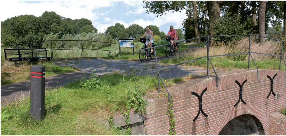
Een van de sluisen in de Elshoutse Zeedijk; essentieel om een stuk land te inunderen