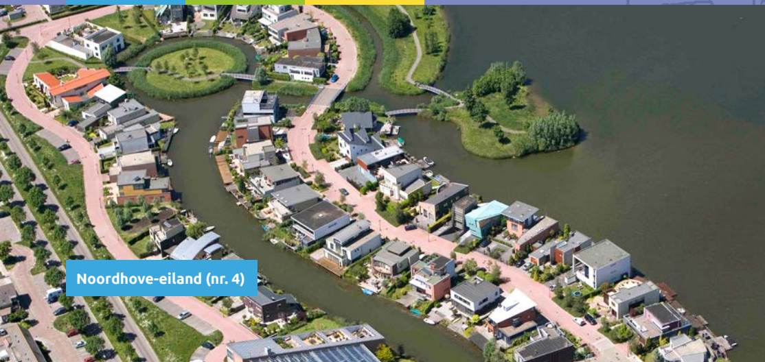
Noordhove-eiland (nr. 4)