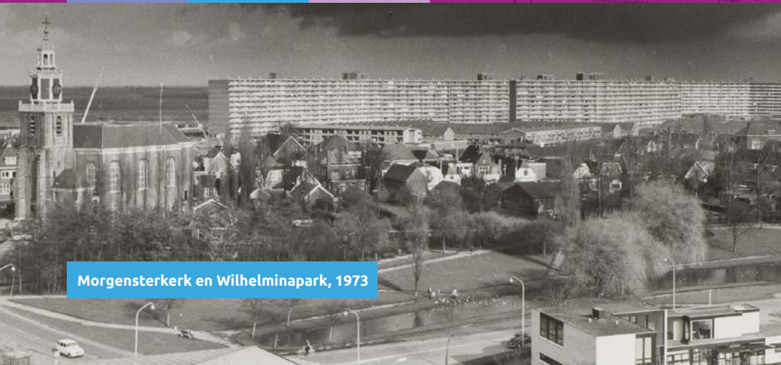
Morgensterkerk en Wilhelminapark, 1973