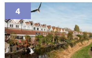
4 WONINGEN EN BUURTHUIS ■ Lissenvaart, Nimfkruidvaart ■ H.A. Knoop en P. Nieuwveld ■ 1981

De karakteristieke 'uitbuikingen' zijn gerealiseerd door een houten skelet in deze zes woningen. Bij deze bouwmethode zijn alle dragende delen boven de fundering gemaakt van hout: muren, vloeren en kapconstructie. De binnenkant van het skelet bestaat uit gipsplaat. Tussen gipsplaat en skelet zijn vocht- en geluidwerende materialen te vinden en de buitenzijde van de woning kan uit hout, steen of een combinatie van beide bestaan. Voor deze woningen waren de toekomstige bewoners ook opdrachtgever; een zogenaamd 'eigenbouwproject'.