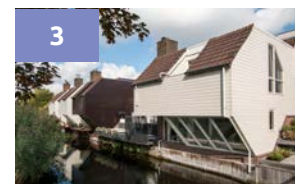
3 HOUSKELETBOUW-WONINGEN ■ Wingerdпарк 87-97 ■ Ben Kraan, 1978

de entree. Door het gehele huis speels verspringende verdiepingen 'split-level' waardoor er verrassende ruimtes ontstaan. Royale huizen zijn het in meerdere varianten. Zoals het type drive-in (nr. 17-31) dat hoog is en wel vier of eigenlijk zeven (!) woonlagen telt in de split-leveltelling.