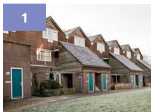
1 PORTIEKWONINGEN ■ Abrikozengarde, Bananengarde, Gaarddreef, Kersengarde, Moerbeigarde, Parkdreef ■ Schippers Architecten ■ 1979