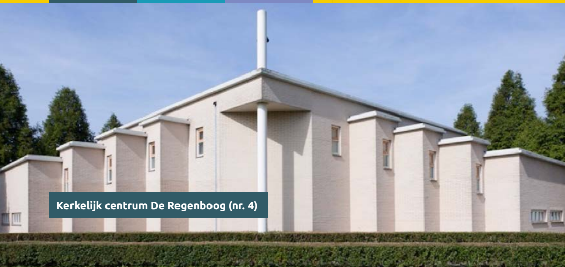
Kerkelijk centrum De Regenboog (nr. 4)