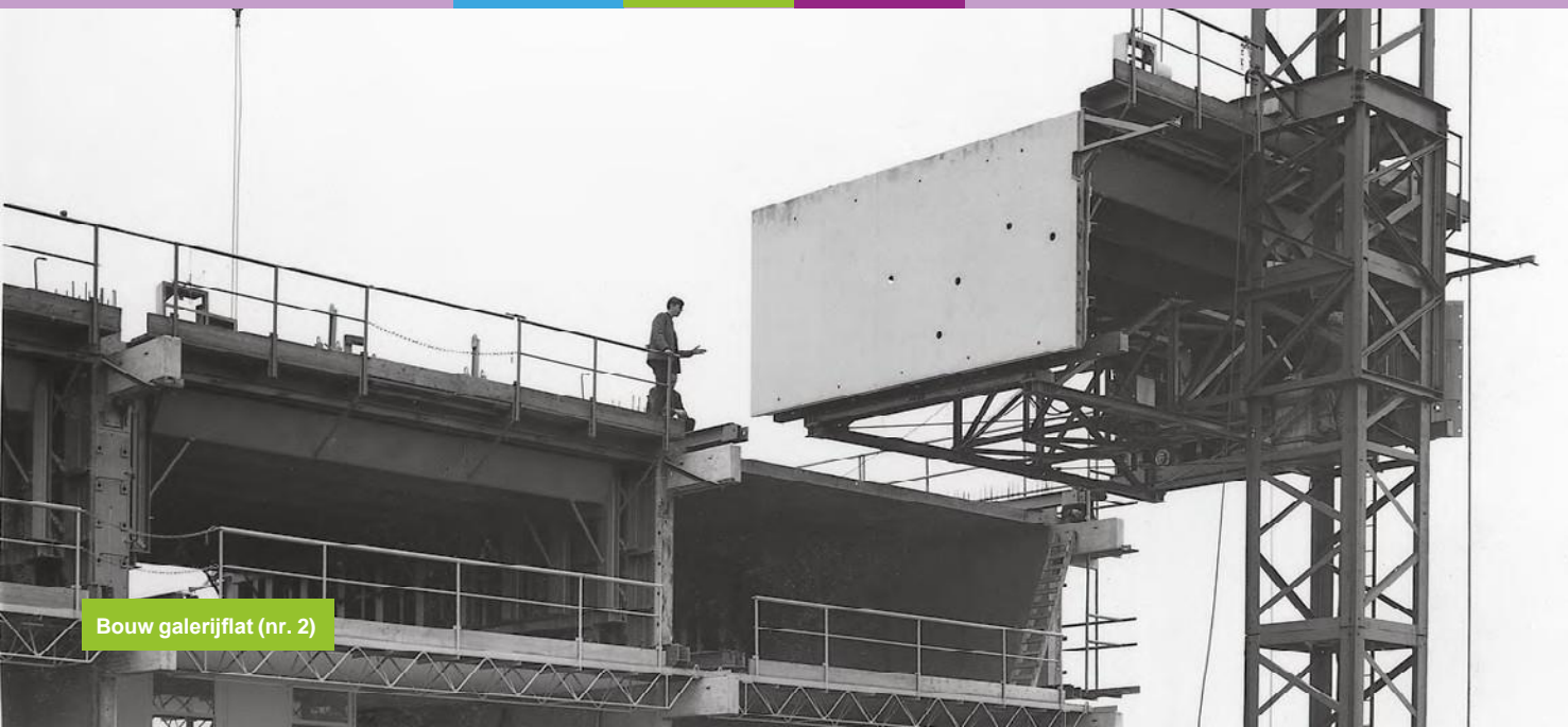
Bouw galerijflat (nr. 2)

Zoetermeer is ontstaan op een hooggelegen veenterp in een groot moerasgebied. In dit relatief hooggelegen deel in het veen was een zoetwatermeer: het 'Soetermeerse meer'. Nadat dit meer tussen 1614 en 1616 is drooggemalen door zogenaamde achtkante riet-gedekte poldermolens is de Meerpolder ontstaan. Er was geen zicht meer op een meer. Wel op een polder. Toch gaat het hier over de wijk met de naam Meerzicht.