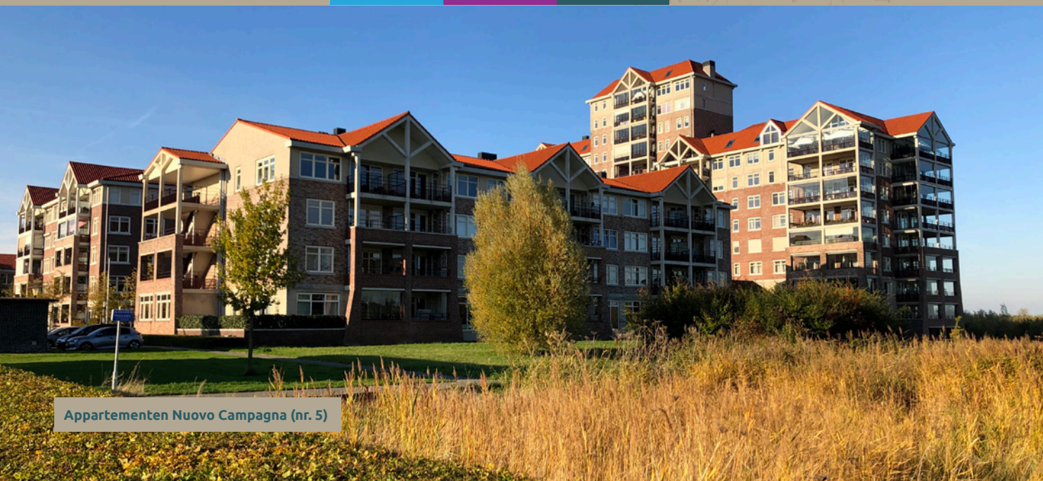
Appartemenen Nuovo Campagna (nr. 5)